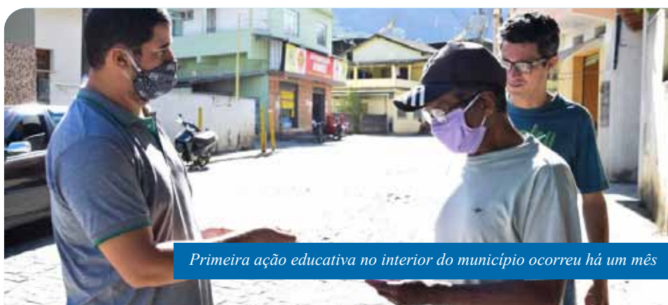
Primeira ação educativa no interior do município ocorreu há um mês

Os moradores também foram orientados a ligar para o telefone da Ouvidoria do SUS (0800 0811 696), caso queiram tirar dúvidas sobre os sintomas da doença. Para denunciar aglomerações em áreas públicas ou descumprimento de normas de