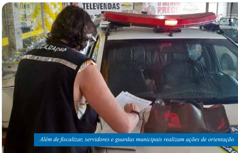
Além de fiscalizar, servidores e guardas municipais realizam ações de orientação

“Tem sido um momento extremamente desafiador, tanto para o poder público, quanto para os comerciantes e para população em geral. Mas