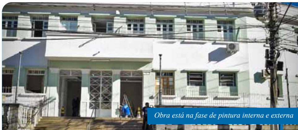
Obra está na fase de pintura interna e externa

“Essa é mais uma importante obra que estamos fazendo na área da saúde. Já entregamos o novo Centro de Saúde “Paulo Pereira Gomes” e estamos melhorando as estruturas das nossas unidades de saúde, com obras de manutenção; novos equipamentos, mobiliário e novas ambulâncias.