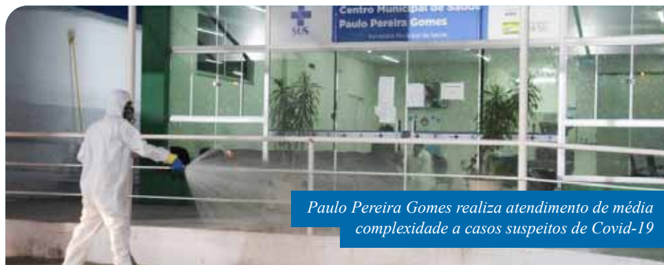
Paulo Pereira Gomes realiza atendimento de média complexidade a casos suspeitos de Covid-19

Para a realização dos serviços de saúde, o PPG disponibiliza 32 leitos, podendo atender até 300 pacientes a cada 24 horas – atualmente, tem realizado de 150 a 200 atendimentos, em média. O equipamento público conta, ainda, com estrutura simplificada, com