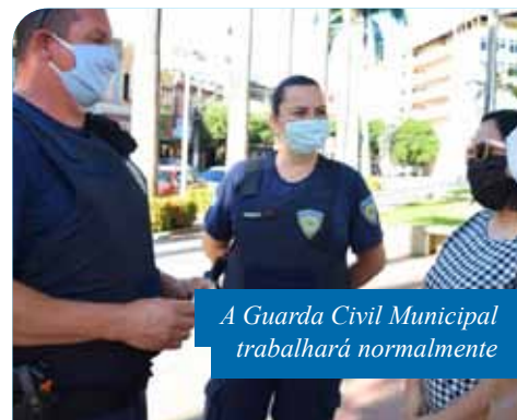
A Guarda Civil Municipal trabalhará normalmente

Para verificar quais farmácias estarão de plantão na quinta (11), os moradores de Cachoeiro podem acessar a lista disponível no site da Prefeitura ( www.cachoeiro.es.gov.br ) – em “Destques”, na parte inferior da página principal, ou no menu “Serviços”, em Vigilância Sanitária.