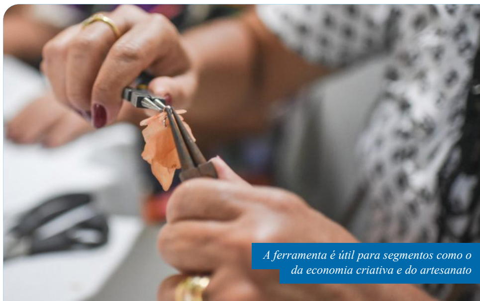
A ferramenta é útil para segmentos como o da economia criativa e do artesanato

Para acessar o guia no portal da Prefeitura de Cachoeiro, basta clicar em “A Cidade” e, depois, em “Turismo”.