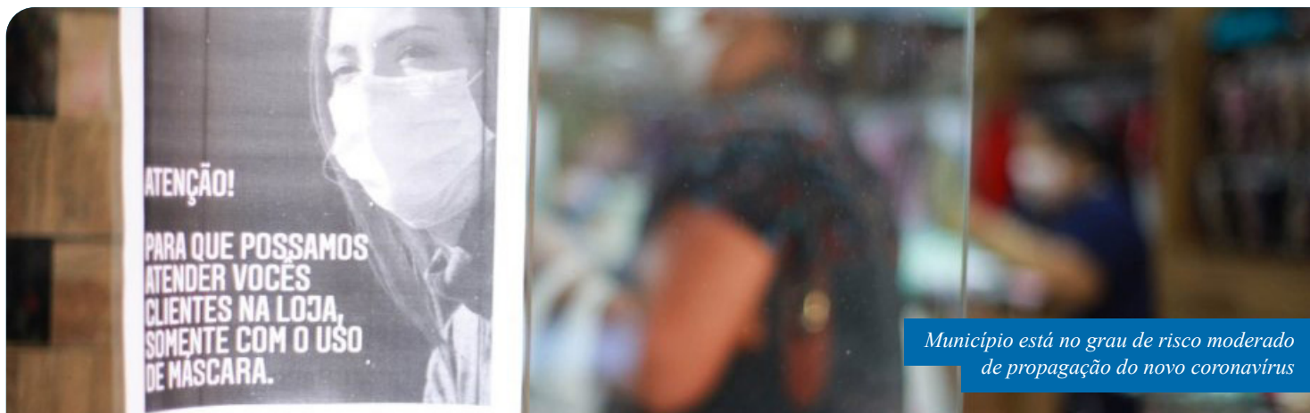
Município está no grau de risco moderado de propagação do novo coronavírus

“São pequenas mudanças que tivemos que fazer, tanto para prorrogar suspensões, como no caso dos equipamentos públicos de lazer e esporte, quanto para realizar ajustes técnicos e de redação que impactam na aplicação das regras. Pedimos a todos que estejam atentos às normas”, explica o prefeito Víctor Coelho.