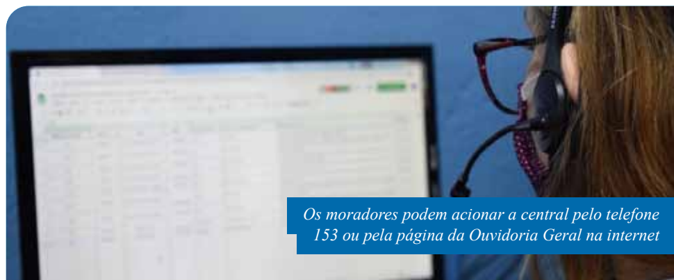
Os moradores podem acionar a central pelo telefone 153 ou pela página da Ouvidoria Geral na internet

A população deve ficar atenta às novas normas de funcionamento dos estabelecimentos para o fim de semana. Com a publicação do decreto nº 29.480, a Prefeitura de Cachoeiro de Itapemirim tornou as regras mais restritivas, tendo em vista que o município passou a se enquadrar na categoria de “grau moderado” de risco de propagação do novo coronavírus.