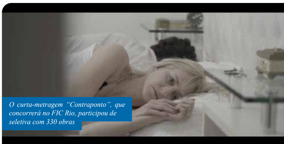
O curta-metragem “Contraponto”, que concorrerá no FIC Rio, participou de seletiva com 330 obras