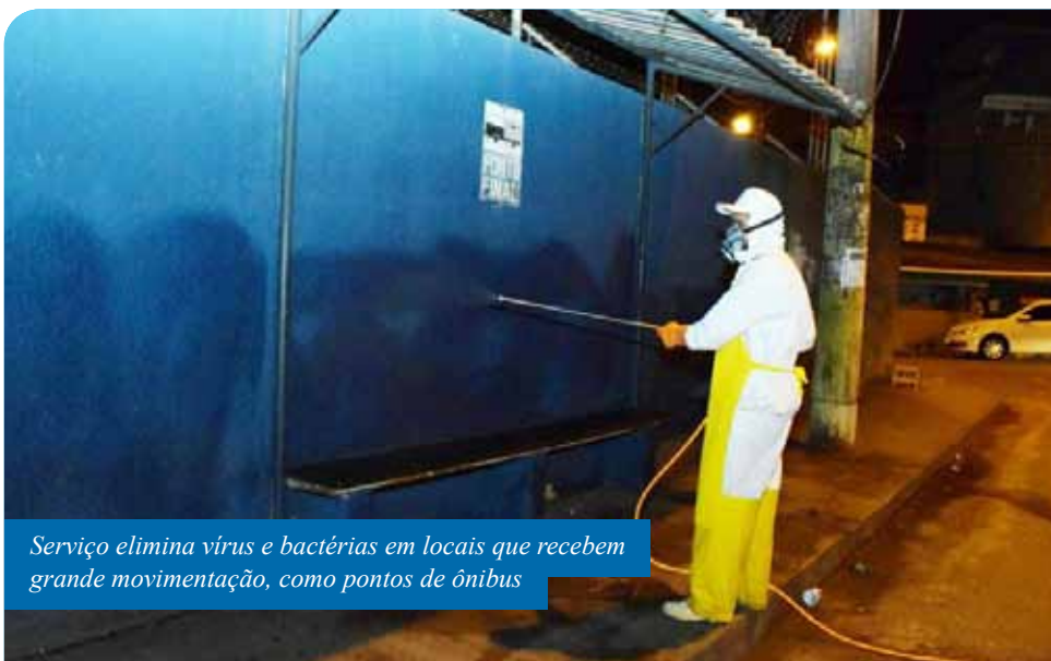
Serviço elimina vírus e bactérias em locais que recebem grande movimentação, como pontos de ônibus

conta com uma equipe de 10 profissionais, é desenvolvido pela equipe da Vigilância Ambiental e consiste na aplicação do desinfetante com o uso de um equipamento pulverizador. São higienizados portas, paredes, calçadas e corrimãos de escadas.