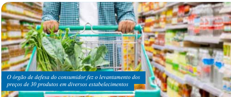
O órgão de defesa do consumidor fez o levantamento dos preços de 30 produtos em diversos estabelecimentos

Itens de limpeza e higiene pessoal também apresentaram variação. O sabão em pó (pacote de 1kg), pode ser encontrado com valores entre R$ 3,89 a R$ 6,99, 79% de diferença. O valor do desodorante spray (90/100ml), por sua vez, alterna em 119,16%, sendo comercializado por R$ 3,60 até R$ 7,89.