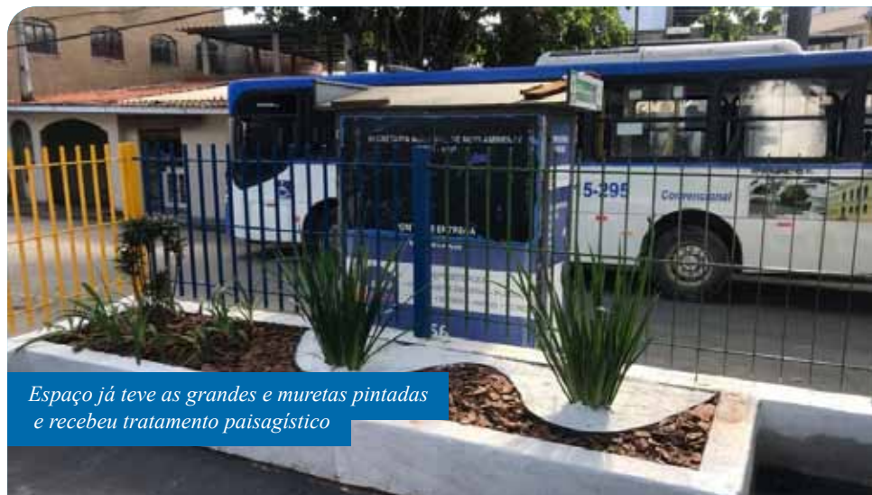
Espaço já teve as grandes e muretas pintadas e recebeu tratamento paisagístico

do projeto Lazer para Todos, já foram contempladas: a Praça de Fátima, na região central; a praça próxima ao campo da Associação de Moradores do bairro Amarelo (Amobam), que também ganhou o Centro de Treinamento de Esportes de Areia (CTEA); as praças dos bairros Paraíso, Nova Brasília (pracinha do Rotary) e do distrito de Gironda.