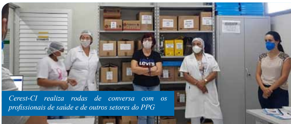
Cerest-CI realiza rodas de conversa com os profissionais de saúde e de outros setores do PPG

O Cerest-CI é dedicado ao atendimento especializado a trabalhadores formais dos setores privado e público, autônomos, informais e desempregados devido a adoecimentos decorrentes das atividades de trabalho. Além da assistência para casos de doenças ou agravos decorrentes das atividades laborais, o órgão realiza ações de orientação, conscientização, bem como levantamentos a respeito da qualidade dos ambientes de trabalho e de dados epidemiológicos dos trabalhadores.