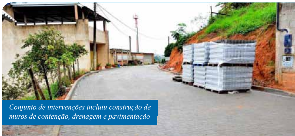
Conjunto de intervenções incluiu construção de muros de contenção, drenagem e pavimentação

“Nosso intuito é o de dar melhores condições de vida aos moradores do B. Bom Pastor. Um cotidiano sem poeira, sem lama. O serviço segue sendo feito, mesmo durante a pandemia do novo coronavírus, para não prejudicar o cronograma das obras. Todos os cuidados foram