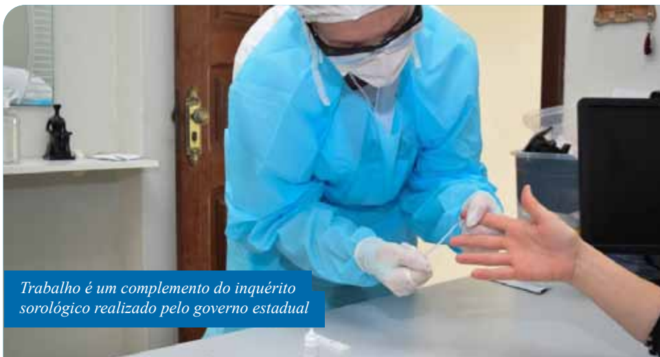
Trabalho é um complemento do inquérito sorológico realizado pelo governo estadual