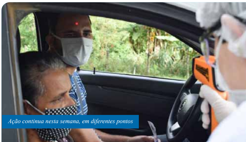
Ação continua nesta semana, em diferentes pontos

No sábado (9), uma barreira foi colocada novamente no ponto próximo ao Horto União. Nesta segunda-feira (11) haverá uma barreira nesse mesmo local e outra em frente ao Posto Rodoviário de Coutinho.