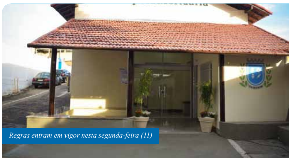
Regras entram em vigor nesta segunda-feira (11)