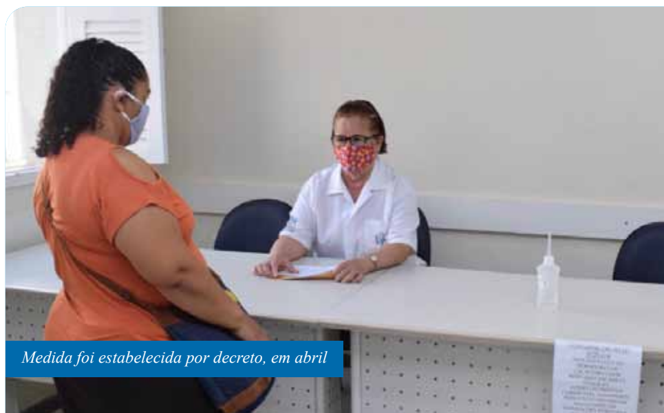
Medida foi estabelecida por decreto, em abril

a infecção, conforme decreto nº 29.350. Para os funcionários municipais, foram adquiridas cerca de 6 mil máscaras e distribuídas centenas de outras confeccionadas na Casa da Costura, da própria administração municipal.