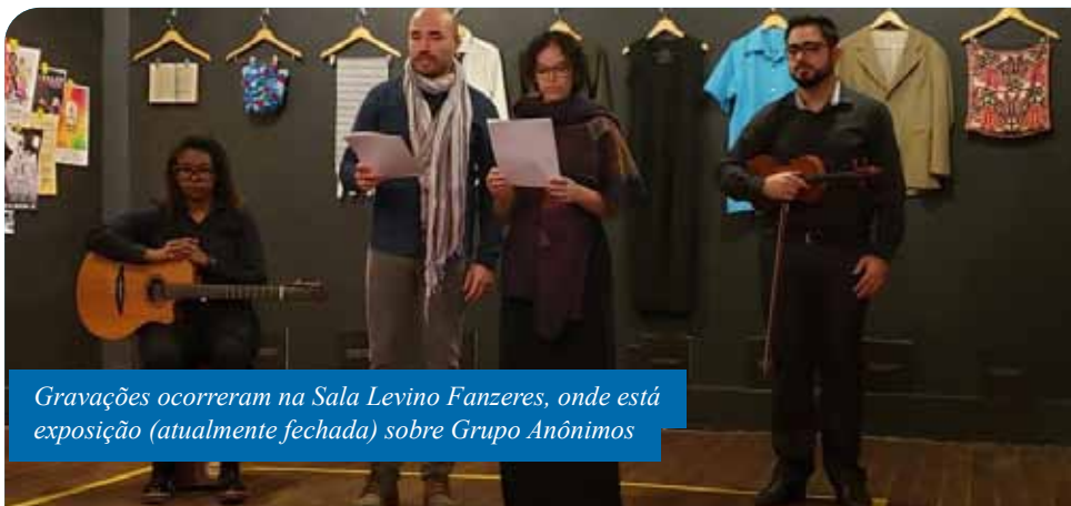
Gravações ocorreram na Sala Levino Fanzeres, onde está exposição (atualmente fechada) sobre Grupo Anônimos