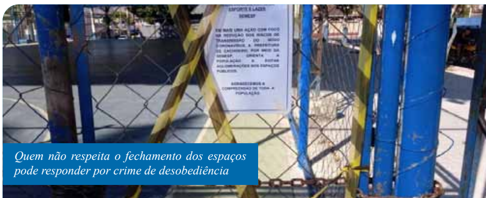
Quem não respeita o fechamento dos espaços pode responder por crime de desobediência

“Essa medida de fechamento não é uma determinação exclusiva de Cachoeiro, é uma recomendação dos órgãos sanitários e foi adotada em várias cidades do país. Neste momento, todos nós precisamos nos