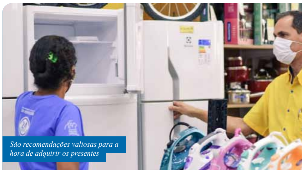
São recomendações valiosas para a hora de adquirir os presentes

Além dessas dicas, há outras, específicas para cada tipo de produto. Acesse o site www.cachoeiro.es.gov.br e confira.