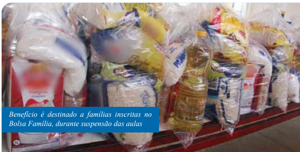
Benefício é destinado a famílias inscritas no Bolsa Família, durante suspensão das aulas

Ainda de acordo com a secretária, cada unidade de ensino possui cronograma próprio de entrega e garante todos os cuidados necessários para evitar aglomerações. “Os beneficiários são contactados pelos gestores escolares para a retirada dos kits”, complementa.