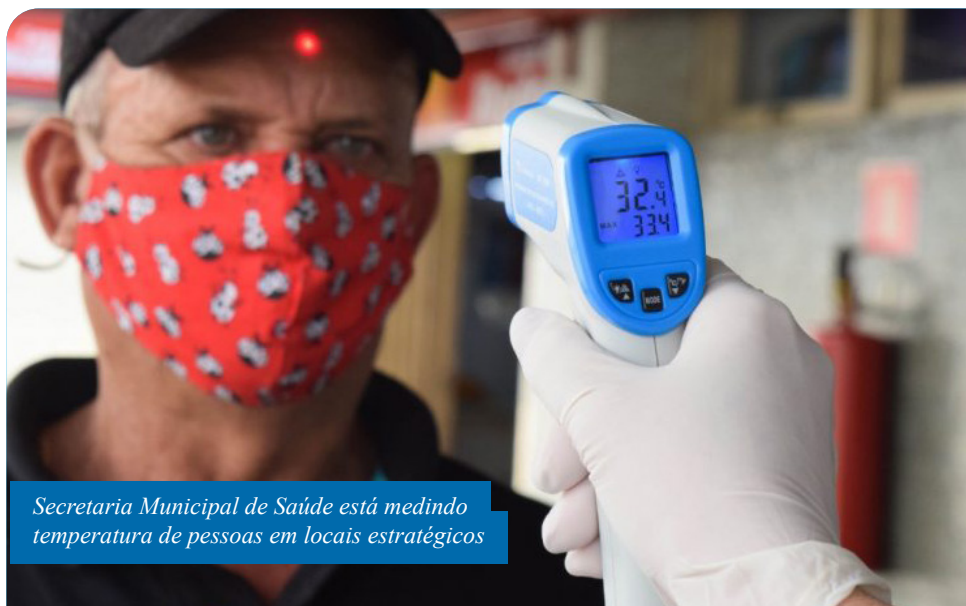
Secretaria Municipal de Saúde está medindo temperatura de pessoas em locais estratégicos

Também ocorre a distribuição de panfletos com orientações importantes, como o uso obrigatório de máscara para quem sai de casa, higienização, isolamento social para o grupo de risco e distanciamento entre as pessoas nas ruas e em filas.