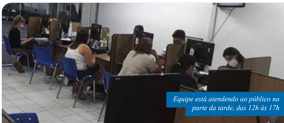
Equipe está atendendo ao público na parte da tarde, das 12h às 17h