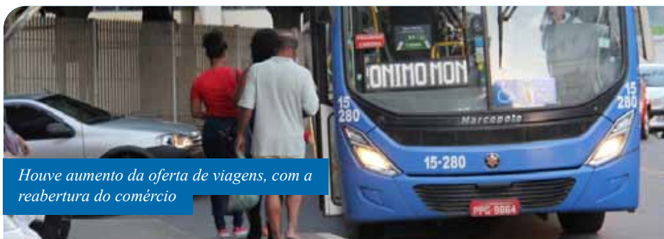
Houve aumento da oferta de viagens, com a reabertura do comércio

“Autorizamos os ajustes operacionais para adequação do serviço às regras de flexibilização do comércio que estão ocasionando o aumento gradativo na circulação de pessoas, e continuaremos monitorando para os ajustes que vierem a ser necessários, sempre visando o bom atendimento aos usuários e, principalmente,