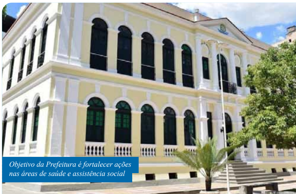
Objetivo da Prefeitura é fortalecer ações nas áreas de saúde e assistência social