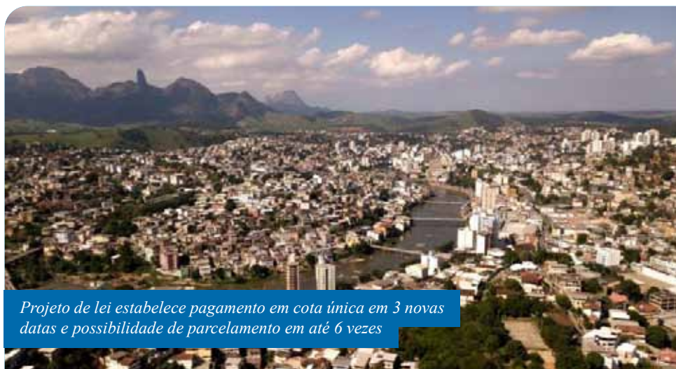
Projeto de lei estabelece pagamento em cota única em 3 novas datas e possibilidade de parcelamento em até 6 vezes

“A proposta visa um alívio financeiro mais imediato aos contribuintes cachoeirenses, considerando que acabamos de enfrentar um