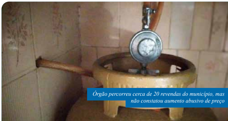
Órgão percorreu cerca de 20 revendas do município, mas não constatou aumento abusivo de preço

Caso o consumidor queira fazer uma denúncia referente ao aumento do preço do gás de cozinha, basta acionar a Ouvidoria Geral do Município, pelo telefone 156, de segunda a sexta, das 9h às 18h, ou pelo Portal do Cidadão ( www.cachoeiro.es.gov.br/ouvidoriageral ). O Procon estadual, que tem contato direto com o órgão municipal, também pode ser acionado pelo telefone 151.