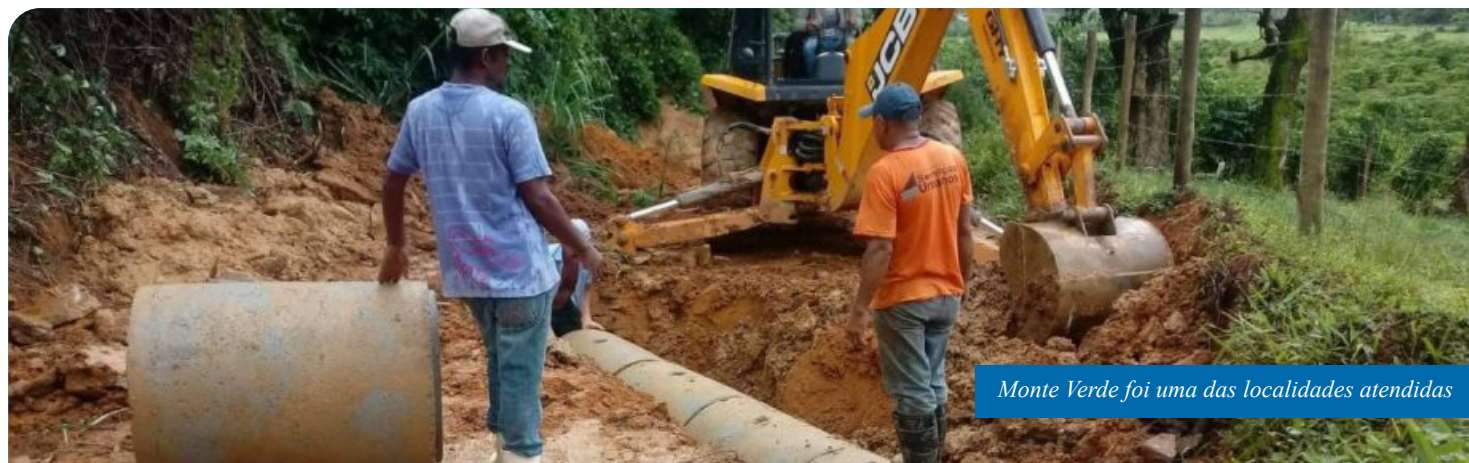
Monte Verde foi uma das localidades atendidas

No caso de São Vicente, o secretário ressalta que as melhorias feitas são ainda mais oportunas, uma vez que, com as obras de reconstrução da ponte da Cachoeira Alta, iniciadas nesta semana, os moradores e visitantes da região terão de usar, como alternativa, a rota por Monte Verde – São José do Cantagalo ou por Cachoeira Alta.