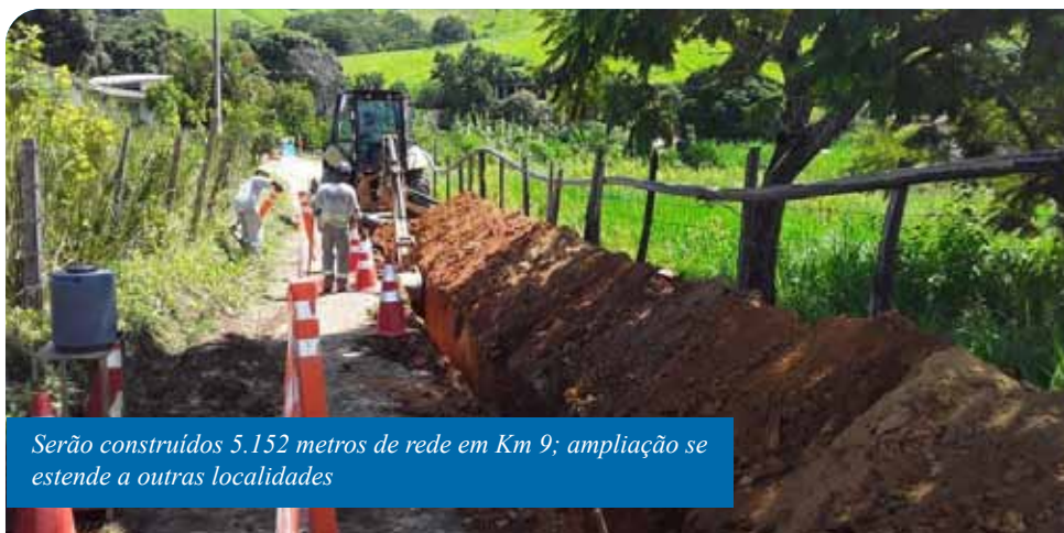
Serão construídos 5.152 metros de rede em Km 9; ampliação se estende a outras localidades

Além de Km 9, está em andamento a construção de 8.839 metros de nova rede em Timbó I – que depende da extração de pedras encontradas sob o solo para a conclusão – e uma extensão de 7.067 metros entre Retiro e Safra, que deverá ser concluída nas próximas três semanas. Também haverá obras em Monte Líbano, relacionadas a uma Estação de Tratamento de Água Comunitária (Etac) e Alto Gironda (735 metros de rede). A previsão é de que todas as intervenções sejam concluídas até o fim de 2020.