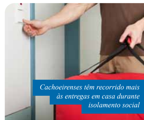
Cachoeirenses têm recorrido mais às entregas em casa durante isolamento social

– É necessário uso de máscaras e luvas pelos manipuladores de alimentos, que devem ser trocadas, no máximo, a cada duas horas.