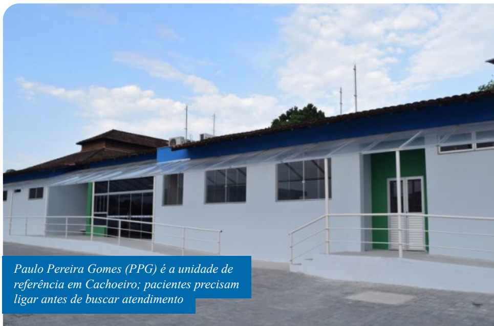
Paulo Pereira Gomes (PPG) é a unidade de referência em Cachoeiro; pacientes precisam ligar antes de buscar atendimento

Casos os sintomas piorarem, é importante ligar antes para a unidade médica para que as medidas de segurança sejam tomadas. Em Cachoeiro, a unidade pública de referência para o atendimento inicial ao novo coronavírus