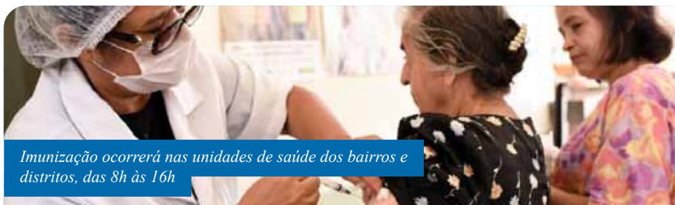
Imunização ocorrerá nas unidades de saúde dos bairros e distritos, das 8h às 16h

idosos residentes em quatro instituições de longa duração: Lar Nina Arueira, Lar João XXIII, Lar Adelson Rebello e Vila Aconchego.