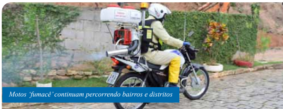
Motos 'fumacê' continuam percorrendo bairros e distritos

“É muito importante que os moradores se atentem