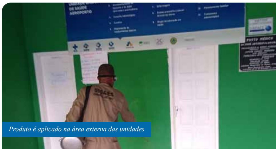
Produto é aplicado na área externa das unidades