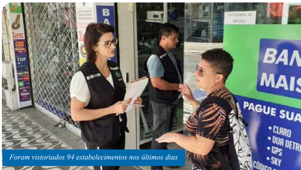
Foram vistoriados 94 estabelecimentos nos últimos dias

O trabalho foi intensificado após a publicação de um decreto, nesta quarta-feira (25), que permitiu o reforço da equipe. A administração municipal autorizou, em caráter excepcional, que auditores fiscais de Defesa do Consumidor (Procon), de Meio Ambiente, de Obras, de Transportes e de Vigilância Sanitária