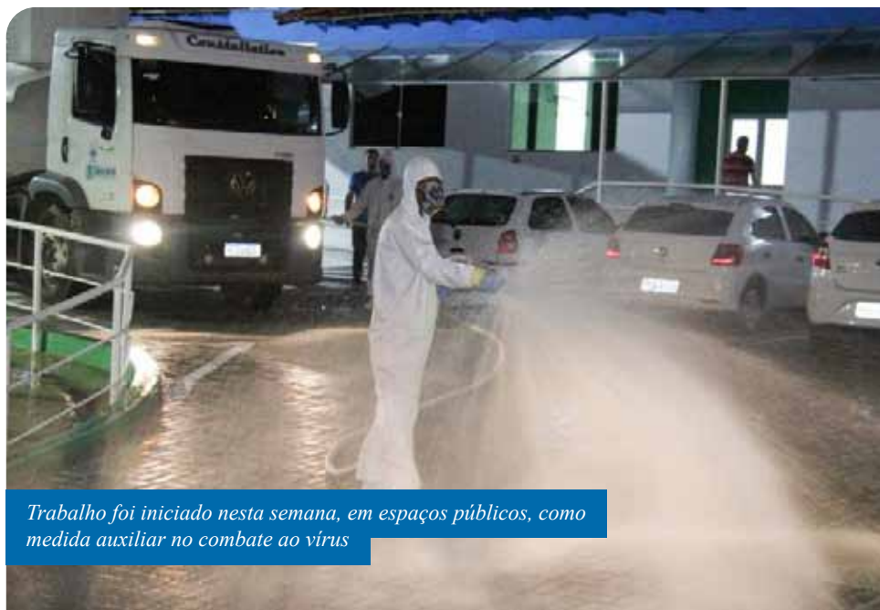
Trabalho foi iniciado nesta semana, em espaços públicos, como medida auxiliar no combate ao vírus

Também nesta quarta, a limpeza foi realizada na área de acesso à Unidade de Pronto Atendimento