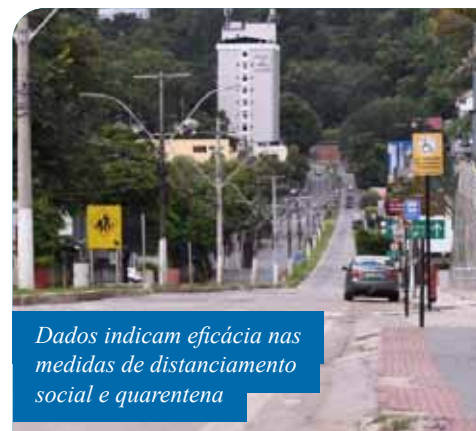
Dados indicam eficácia nas medidas de distanciamento social e quarentena

Outras ações adotadas incluem: reorganização do transporte coletivo, impedindo aglomerações; distribuição de mais medicamentos a grupos de risco na Farmácia Municipal; suspensão do corte de água de consumidores inadimplentes por 60 dias; adoção de novo número de telefone pela Ouvidoria Geral; e publicação de página no portal da prefeitura com