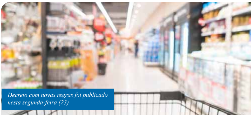
Decreto com novas regras foi publicado nesta segunda-feira (23)

No caso dos locais destinados a velórios, esses