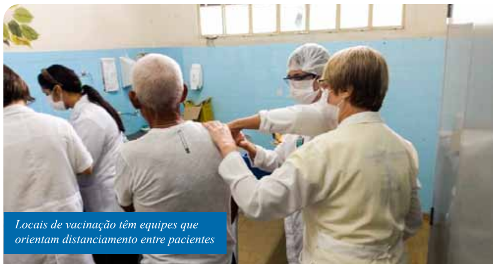
Locais de vacinação têm equipes que orientam distanciamento entre pacientes

Outra opção é marcar o dia e horário da vacinação por meio do site agendamento.cachoeiro.es.gov.br . Há dez unidades básicas de saúde no município que permitem a