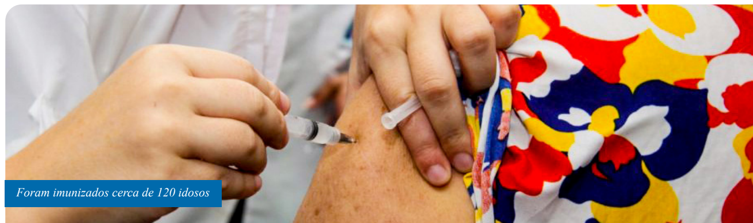
Foram imunizados cerca de 120 idosos