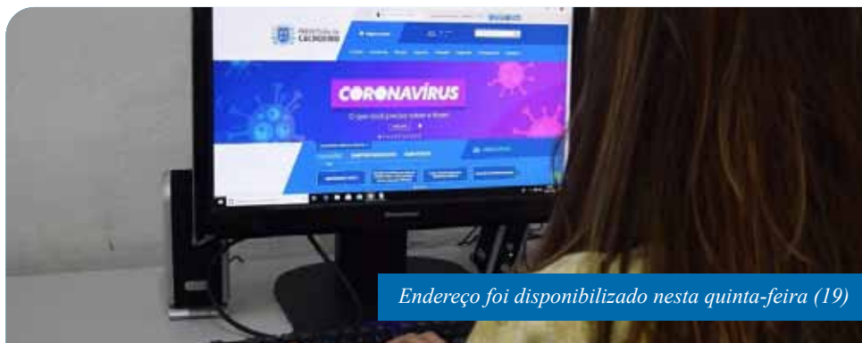
Endereço foi disponibilizado nesta quinta-feira (19)

Para ter acesso a informações corretas sobre o coronavírus, a Prefeitura de Cachoeiro recomenda os canais de órgãos oficiais. É o caso do aplicativo de celular “Coronavírus – SUS”, do Ministério da Saúde, que, além de instruir sobre prevenção, formas de transmissão e onde buscar atendimento, faz a checagem da veracidade de notícias sobre a covid-19. O