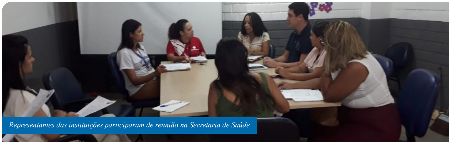
Representantes das instituições participaram de reunião na Secretaria de Saúde

Em reunião nesta terça-feira (17), a Secretaria de Saúde de Cachoeiro repassou a Instituições de Longa Permanência de Idosos orientações para prevenção e controle dos riscos de infecção pelo novo coronavírus.