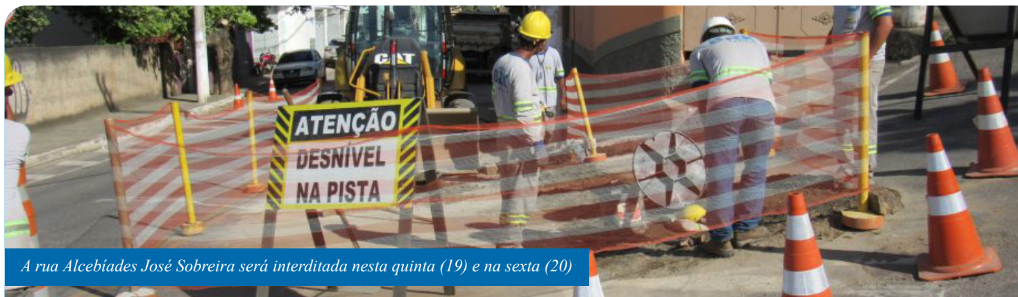
A rua Alcebiades José Sobreira será interditada nesta quinta (19) e na sexta (20)

A concessionária de abastecimento de água e tratamento de esgoto de Cachoeiro de Itapemirim começa, nesta quinta-feira (19), mais uma obra de execução de redes de esgotamento sanitário. Desta vez, a região atendida é a rua Alcebiades José Sobreira, no bairro Waldir Furtado Amorim (BNH de Baixo). A via será interditada totalmente para o trânsito de veículos, das 7h às 17h, quinta e sexta-feira (20).