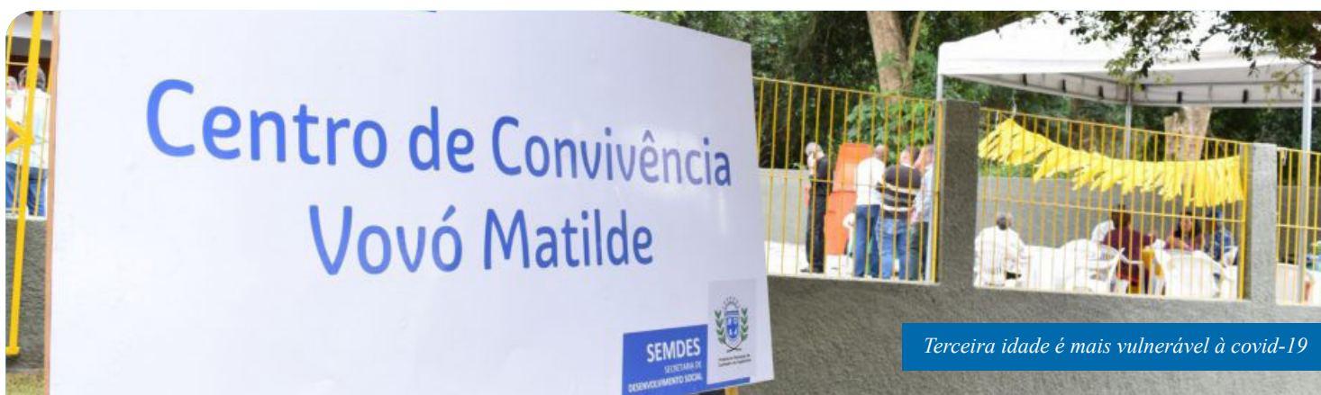
Terceira idade é mais vulnerável à covid-19

A Prefeitura de Cachoeiro já tomou uma série de outras medidas preventivas relacionadas ao novo coronavírus, como a decretação de Estado de Emergência em Saúde, cancelamento e adiamento de eventos oficiais e a suspensão de visitação a centros culturais e de atividades de núcleos esportivos (que também contam com a participação de muitos idosos).