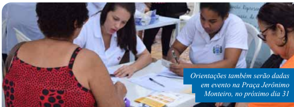
Orientações também serão dadas em evento na Praça Jerônimo Monteiro, no próximo dia 31

“Prevenção aliada ao conhecimento são ações que podem diminuir a incidência desse mal que