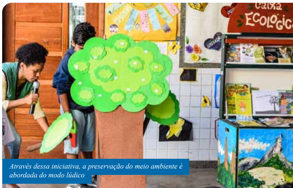
Através dessa iniciativa, a preservação do meio ambiente é abordada do modo lúdico