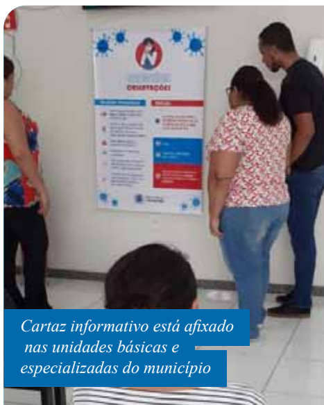
Cartaz informativo está afixado nas unidades básicas e especializadas do município

Além disso, as equipes das unidades receberam orientações de como atender possíveis casos da doença a partir de um fluxograma fornecido pelo Ministério da Saúde. O documento indica procedimentos a serem adotados, como manter pacientes com suspeita de