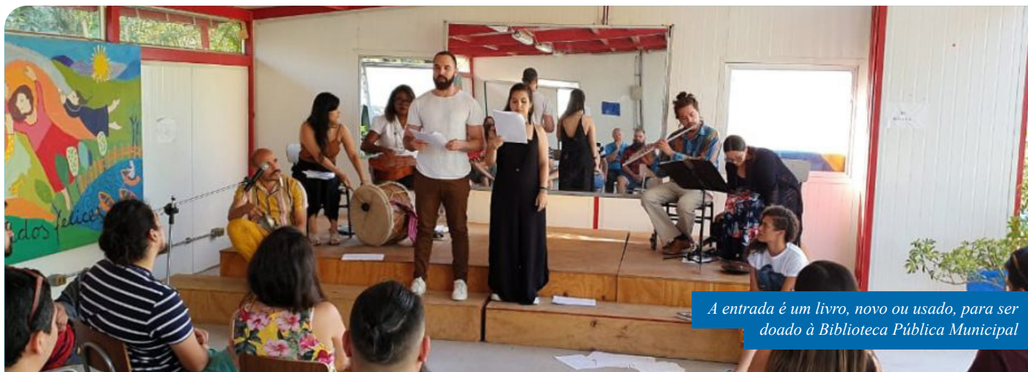
A entrada é um livro, novo ou usado, para ser doado à Biblioteca Pública Municipal

O sarau é uma realização do Grupo Anônimos de Teatro, com produção da Companhia do Outro.