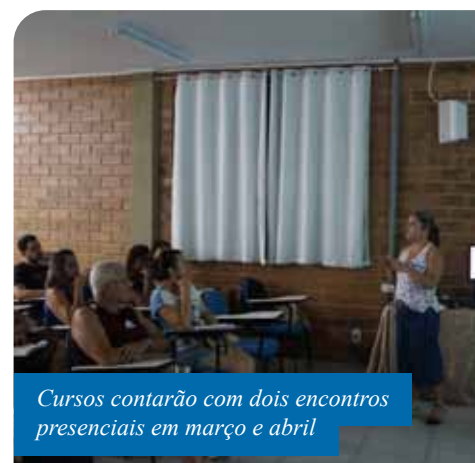
Cursos contarão com dois encontros presenciais em março e abril

educacionais financiados pelo Fundo Nacional de Desenvolvimento da Educação (FNDE).