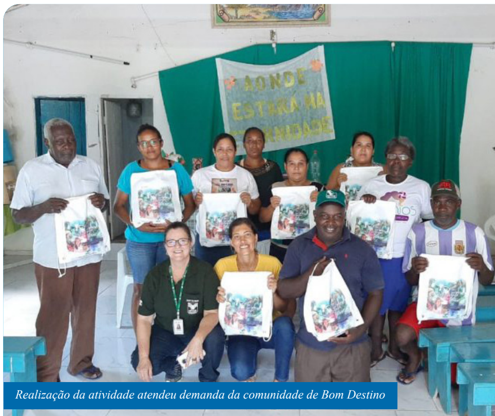
Realização da atividade atendeu demanda da comunidade de Bom Destino

A Semai atende à demanda das comunidades com sua estrutura própria ou por meio de parcerias como o Senar e o Serviço Brasileiro de Apoio às Micro e Pequenas Empresas (Sebrae). Os interessados devem procurar