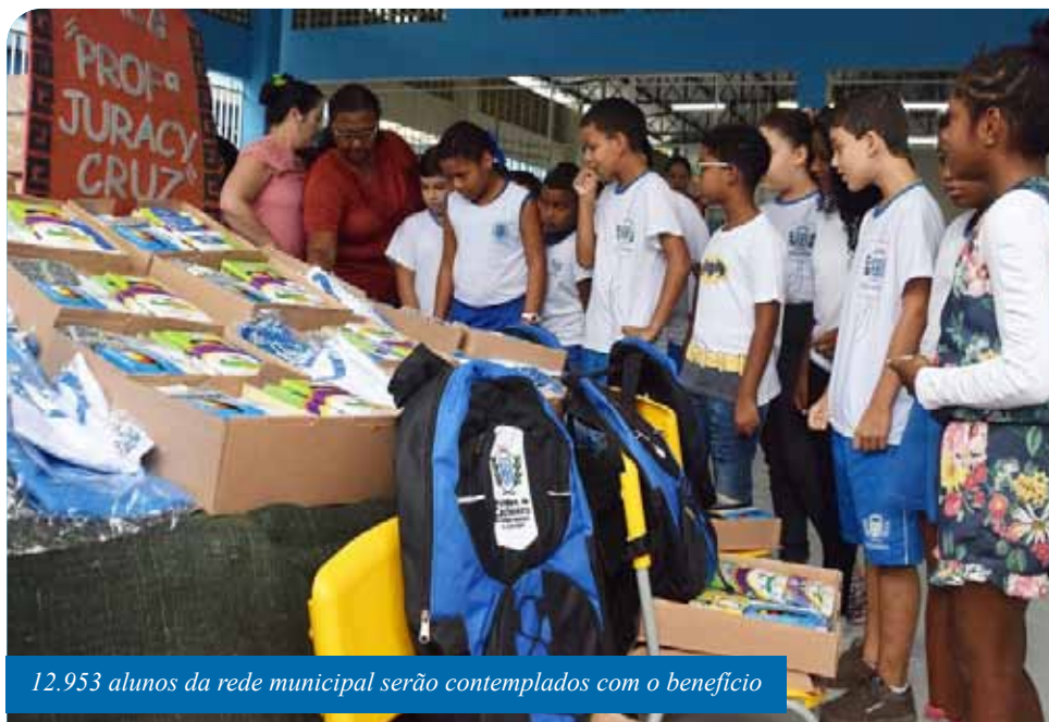
12.953 alunos da rede municipal serão contemplados com o benefício

“Hoje é um dia de festa, devemos comemorar. A entrega desses kits foi a conquista de uma batalha na qual lutamos muito. Ficamos muito felizes de poder