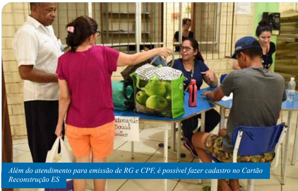
Além do atendimento para emissão de RG e CPF, é possível fazer cadastro no Cartão Reconstrução ES

documentos após a enchente em Cachoeiro, e o mutirão terá como foco principal prestar esse atendimento. O nosso intuito é que todos sejam atendidos da melhor forma possível, mesmo as pessoas se dirigirem até nós apenas para receber orientações”, destaca o prefeito Victor Coelho.