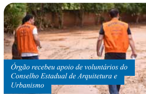
Órgão recebeu apoio de voluntários do Conselho Estadual de Arquitetura e Urbanismo

Equipes da Defesa Civil estarão disponíveis no Mutirão da Cidadania, que acontecerá nesta sexta-feira (14), das 9h às 18h, e sábado (15), das 9h às 15h, para realizarem vitórias e emitir laudos a quem precisar. O evento será realizado no Pavilhão de Eventos da Ilha da Luz, e dará oportunidade de solicitação 2º via de documentos como RG e CPF, além de agendamento para emissão gratuita das certidões de nascimento e casamento e da carteira de trabalho.