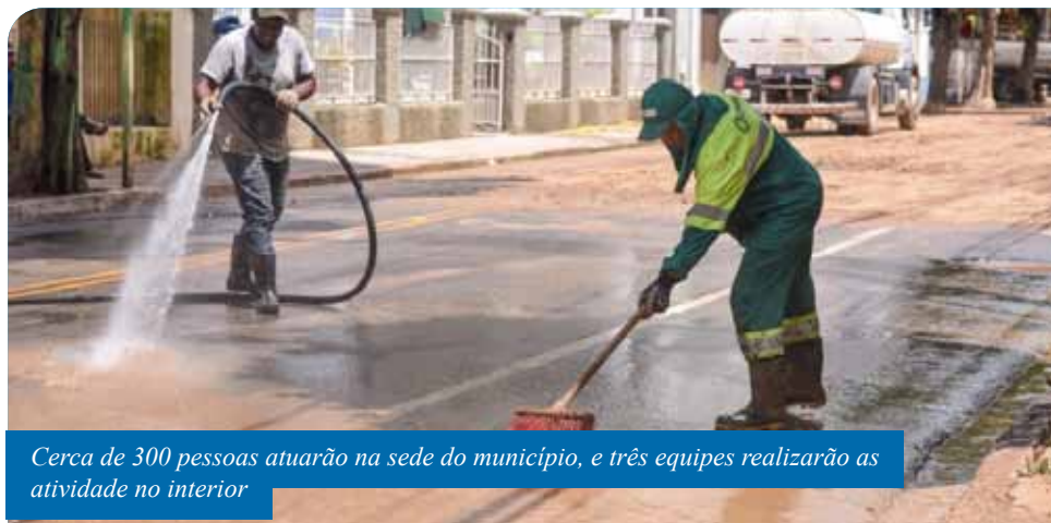
Cerca de 300 pessoas atuarão na sede do município, e três equipes realizarão as atividades no interior

Agentes de trânsito estarão nas ruas para coordenar o tráfego. Por conta das alterações, a