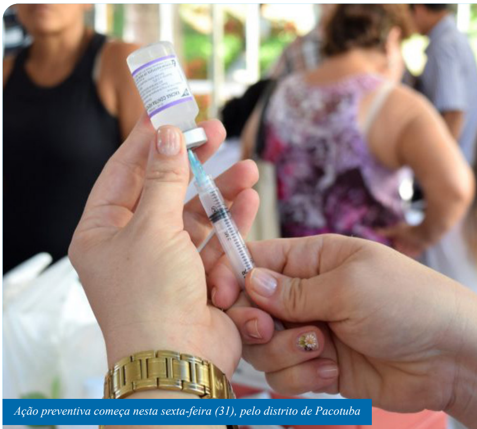
Ação preventiva começa nesta sexta-feira (31), pelo distrito de Pacotuba

O vírus da hepatite A é adquirido por via oral