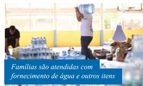
Famílias são atendidas com fornecimento de água e outros itens

Banco: Banestes Agência: 0115 Conta: 30.458.152 Beneficiário: Prefeitura de Cachoeiro de Itapemirim CNPJ: 27.165.588/0001-90