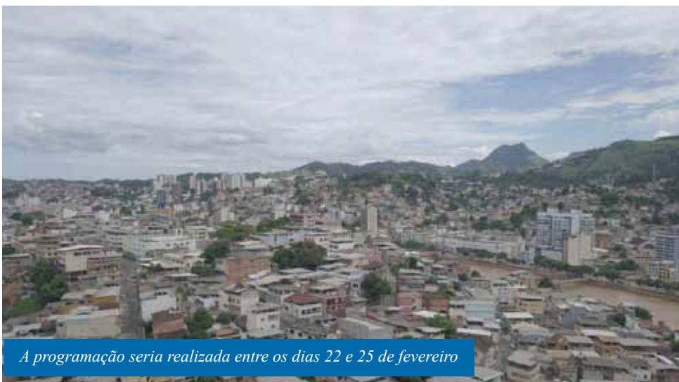
A programação seria realizada entre os dias 22 e 25 de fevereiro