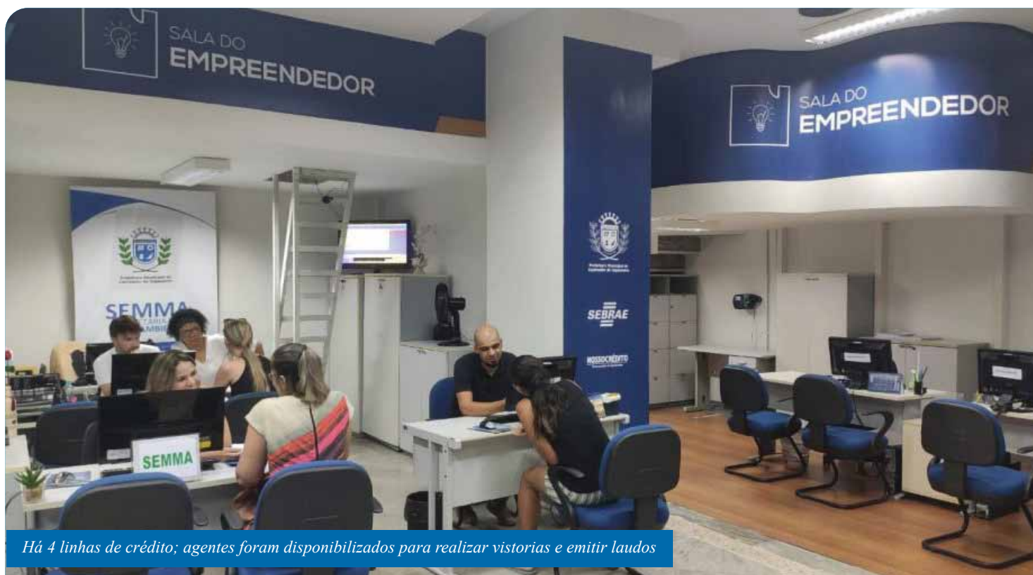
Há 4 linhas de crédito; agentes foram disponibilizados para realizar vistorias e emitir laudos

A Sala do Empreendedor da Prefeitura de Cachoeiro está prestando atendimento sobre linhas de crédito emergenciais para os comerciantes e empreendedores afetados pela enchente. O crédito emergencial é oriundo do Fundo Reconstrução ES, lançado pelo Banco de Desenvolvimento do Espírito Santo (Bandes) e operado pelo Banestes para a recuperação da atividade econômica dos municípios afetados.