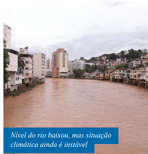
Nível do rio baixou, mas situação climática ainda é instável