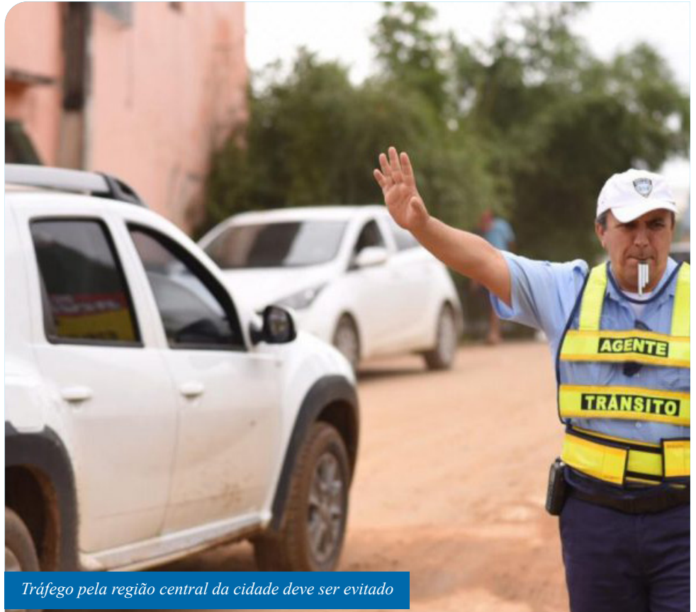
Tráfego pela região central da cidade deve ser evitado