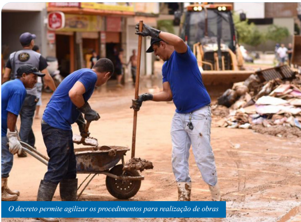
O decreto permite agilizar os procedimentos para realização de obras

“Nós já havíamos feito um decreto de ‘Situação de Emergência’ na sexta-feira (24), antes mesmo do ‘Alerta Vermelho’. Agora, diante dos acontecimentos dos últimos dias, faz-se necessário decretar ‘Calamidade Pública’. Estamos tomando todas as medidas para que a cidade volte à normalidade o mais rápido possível”, destaca o prefeito.