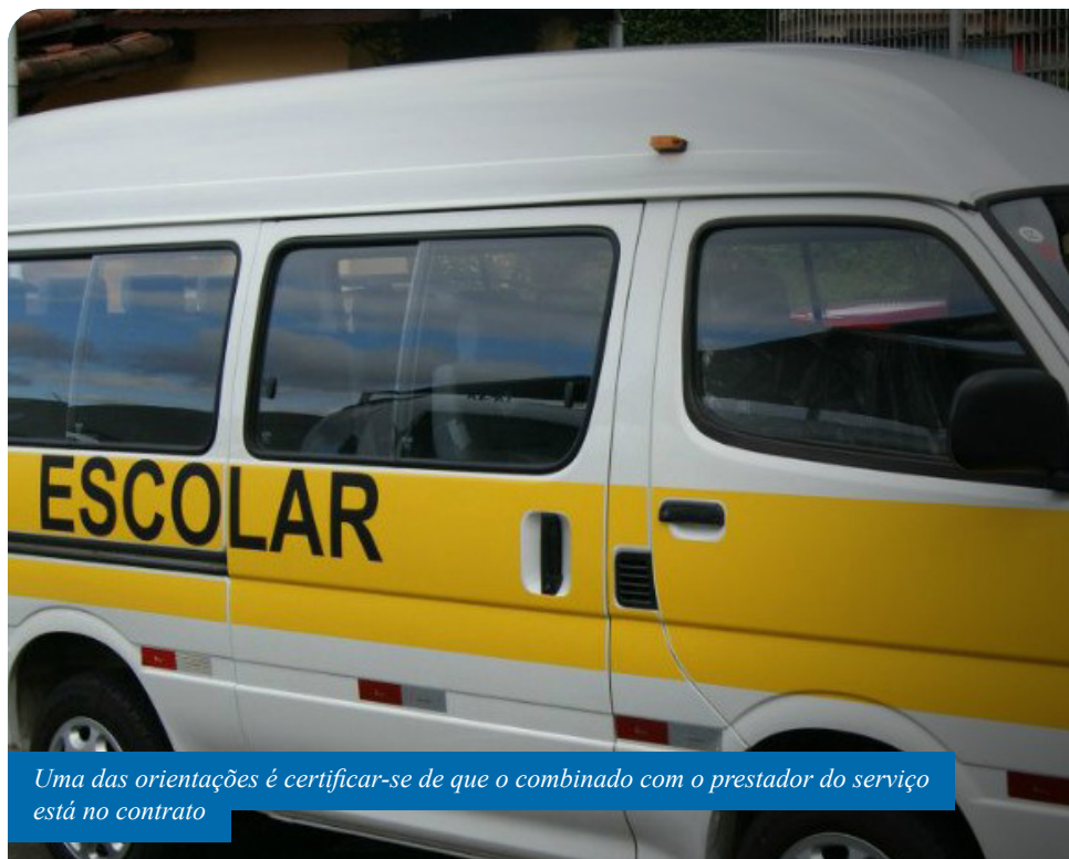
Uma das orientações é certificar-se de que o combinado com o prestador do serviço está no contrato

Ele acrescenta, ainda, que, antes mesmo de firmar contrato, os pais devem buscar referências