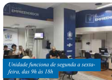
Unidade funciona de segunda a sexta-feira, das 9h às 18h

de microcrédito; orientação gerencial sobre abertura de empresas, viabilidade, regularização, orientação sanitária e ambiental; licenças e alvarás; negociação de débitos; atendimentos de orientações itinerantes nos bairros; parceria com o sistema S para atendimentos empresariais e orientações sobre como participar de compras governamentais.