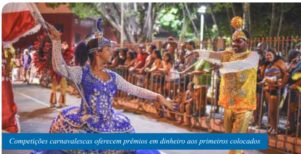
Competições carnavalescas oferecem prêmios em dinheiro aos primeiros colocados

Já para seleção de artistas para confecção e