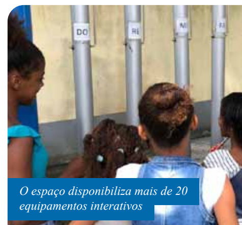
O espaço disponibiliza mais de 20 equipamentos interativos