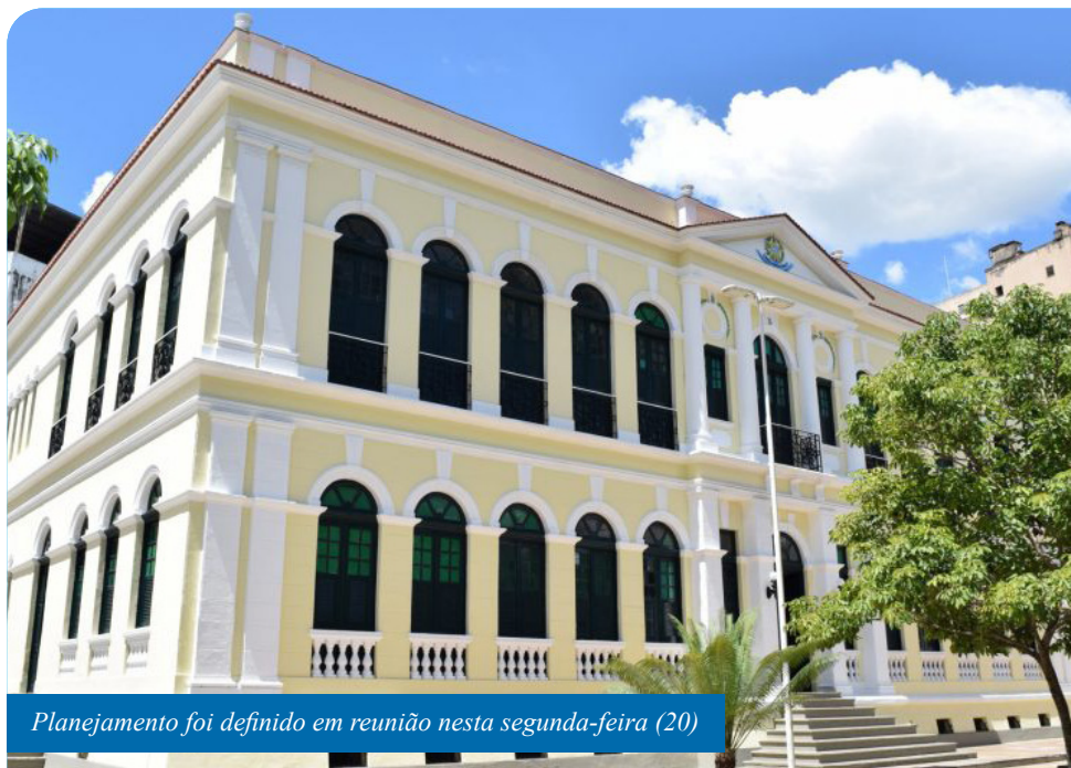
Planejamento foi definido em reunião nesta segunda-feira (20)

Além de estar alerta para ocorrências, a Defesa Civil de Cachoeiro faz algumas recomendações aos moradores. Uma das instruções é para que, em caso de tempestade com raios e ventos fortes, fiquem em casa ou se abriguem em local seguro até que o temporal passe. Havendo alagamentos ou enchentes, é necessário evitar contato com a