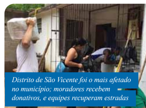
Distrito de São Vicente foi o mais afetado no município; moradores recebem donativos, e equipes recuperam estradas

O Pavilhão da Ilha da Luz continuará a receber doações durante toda a semana, sempre das 9h30 às 17h.