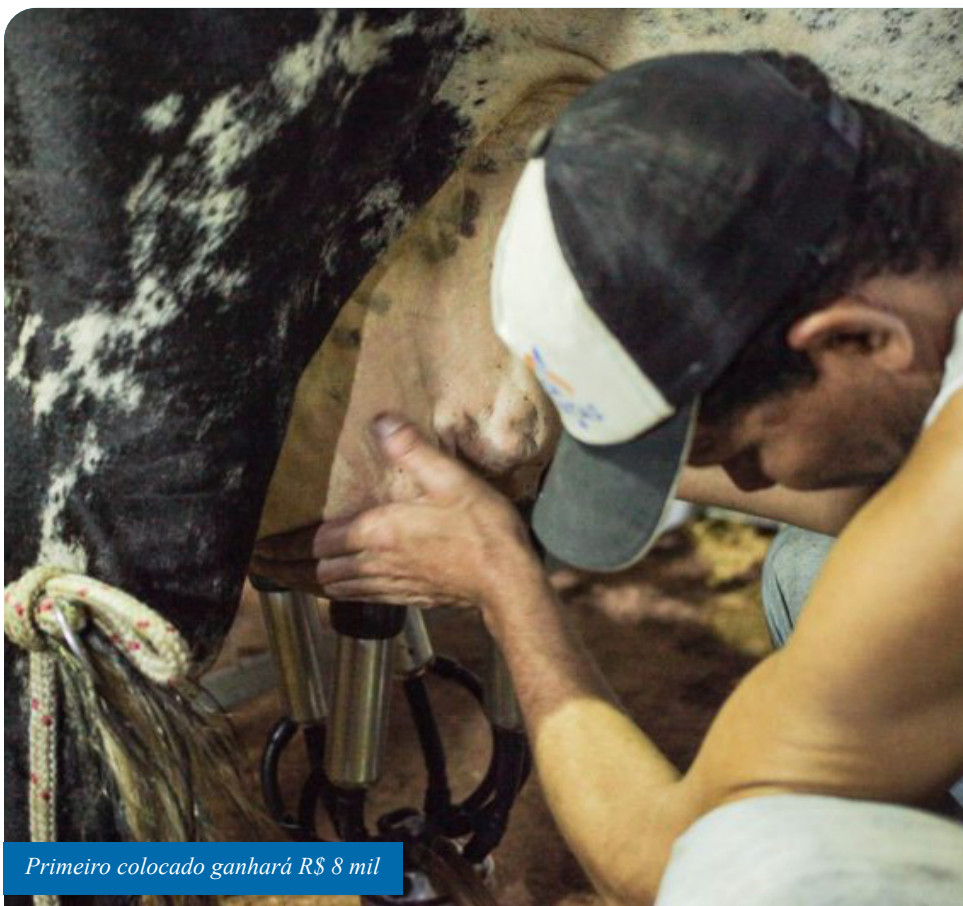
Primeiro colocado ganhará R$ 8 mil

As inscrições podem ser feitas de segunda a sexta-feira, nos seguintes locais: na Subsecretaria de Infraestrutura da Semai (Parque de Exposições do Aeroporto), das 7h às 11h e das 12h às 16h; na sede da Selita, (Av. Dr. Aristides Campos, 294, Campo Leopoldina), das 8h às 17h; na Escola Família Agrícola (Pacotuba, Fazenda Experimental Bananal do Norte), das 8h às 16h; no escritório do Incaper (R. Dom Fernando, 29, Independência); e em Castelo, na Cooperativa Agrária Mista do município – Cacal – (R. Jocarly Garcia, 495, bairro São Miguel).