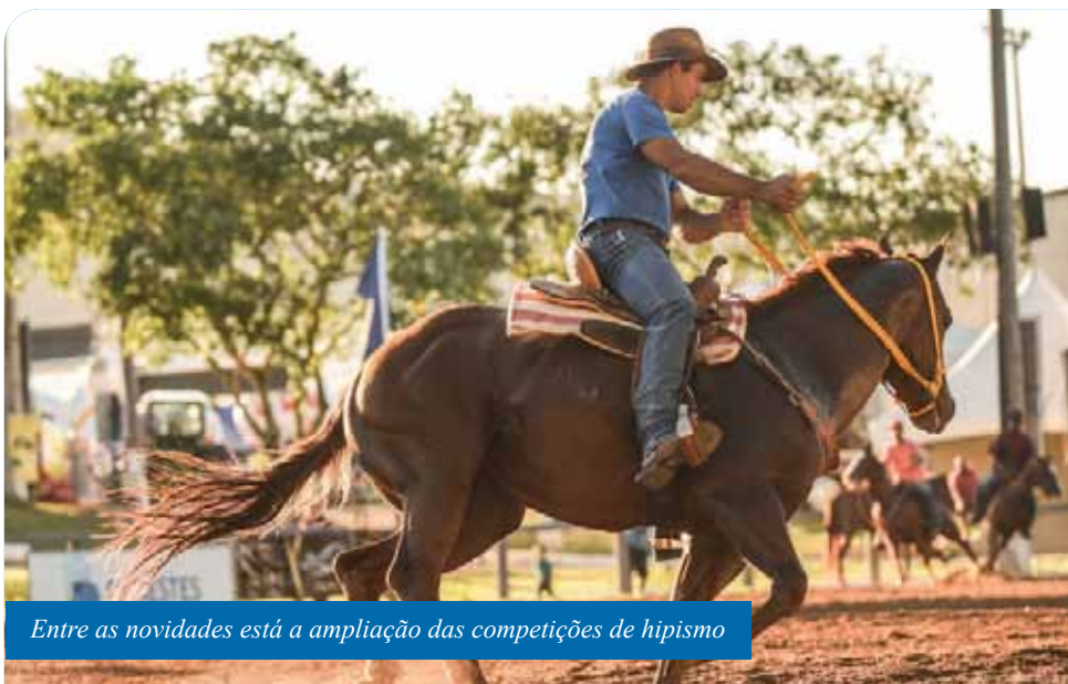
Entre as novidades está a ampliação das competições de hipismo

“A expectativa é muito grande em Cachoeiro