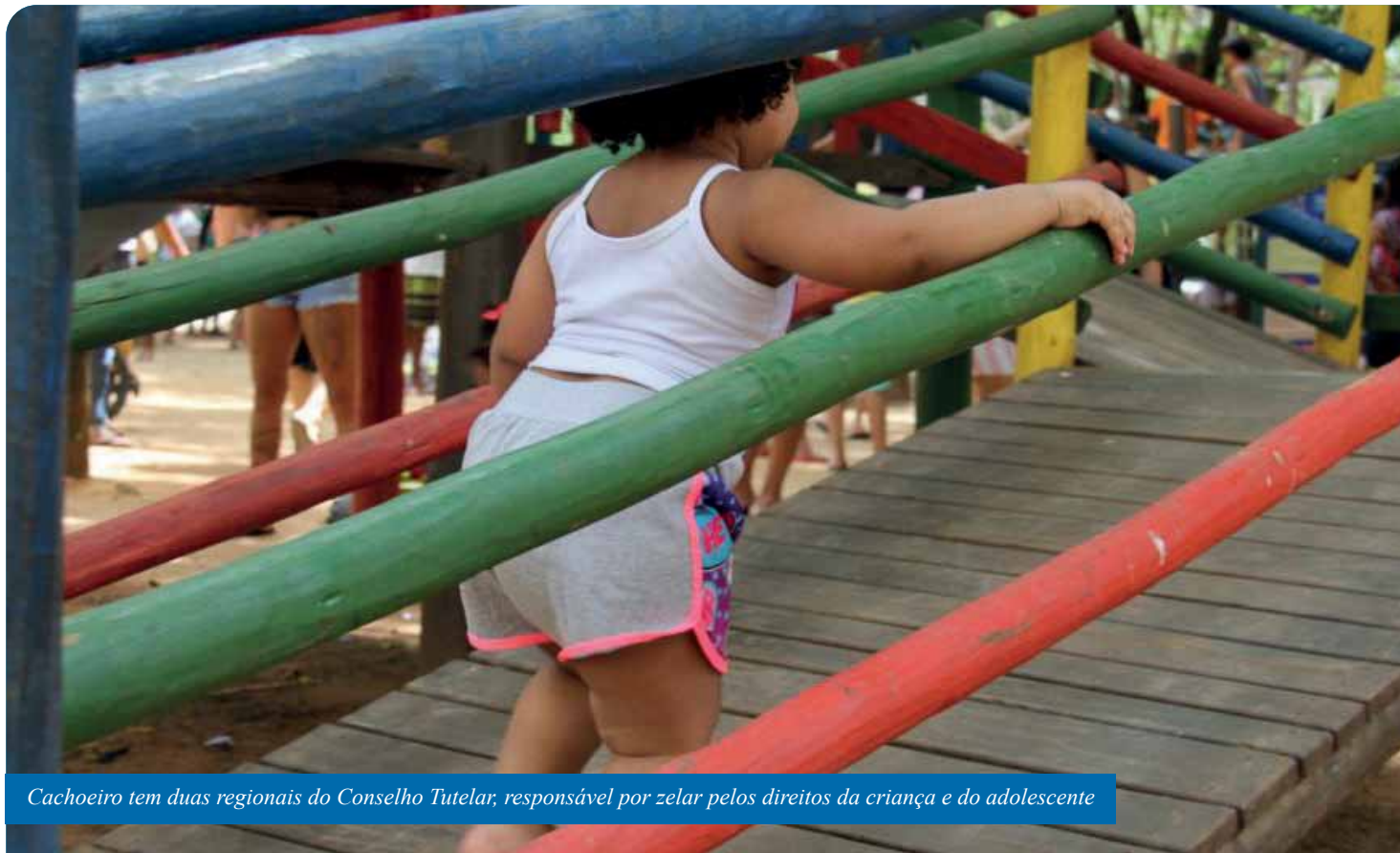
Cachoeiro tem duas regionais do Conselho Tutelar, responsável por zelar pelos direitos da criança e do adolescente

A posse dos novos conselheiros tutelares de Cachoeiro de Itapemirim será realizada nesta sexta-feira (10), na Câmara Municipal, a partir das 9h. São dez conselheiros titulares e dez suplentes, e os eleitos cumprirão mandato de quatro anos, atuando nas regionais I e II do Conselho Tutelar do município. A solenidade é aberta ao público.