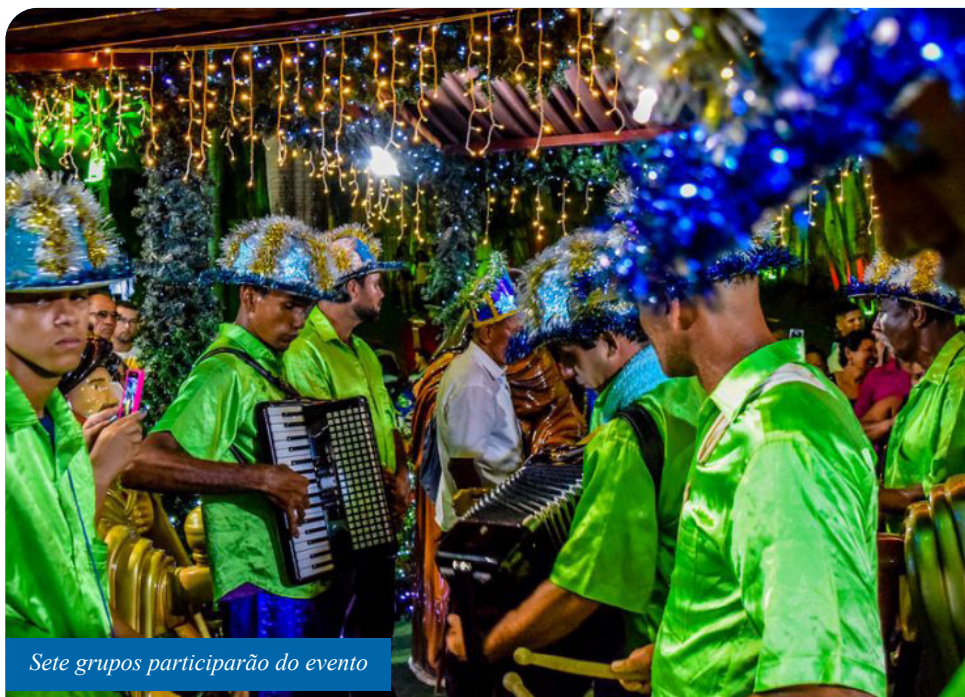
Sete grupos participarão do evento

“A Folia de Reis é um folguedo de uma linda simbologia e muito representativo da nossa