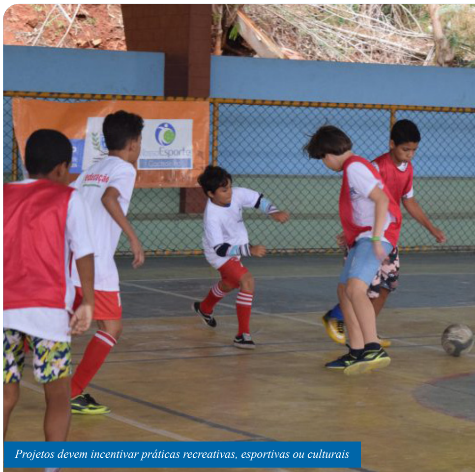
Projetos devem incentivar práticas recreativas, esportivas ou culturais

“Visamos a propostas que possam incentivar, ainda mais, o desenvolvimento cognitivo e de competências dos nossos alunos. Valorizamos as parcerias e convidamos as instituições