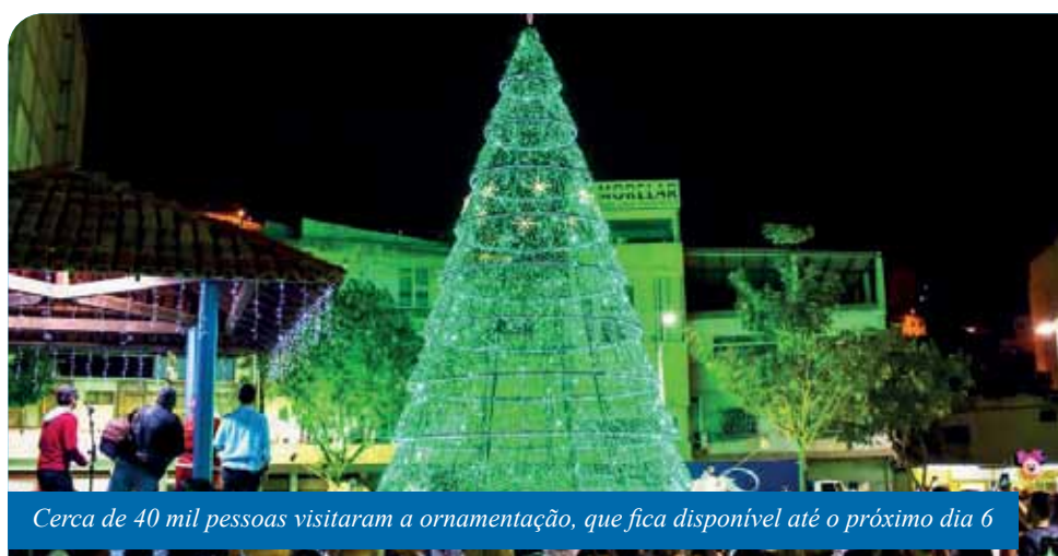
Cerca de 40 mil pessoas visitaram a ornamentação, que fica disponível até o próximo dia 6

Para facilitar o acesso de moradores do interior do município ao Natal Mágico, um ônibus e uma van decorados foram disponibilizados pela Secretaria Municipal de Gestão de Transportes (Semtra). Foram atendidos as comunidades de Burarama, São Joaquim, Conduru, Tijuca, São