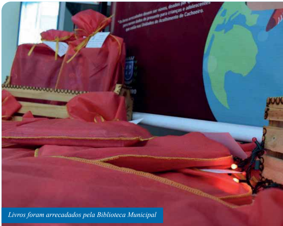
Livros foram arrecadados pela Biblioteca Municipal