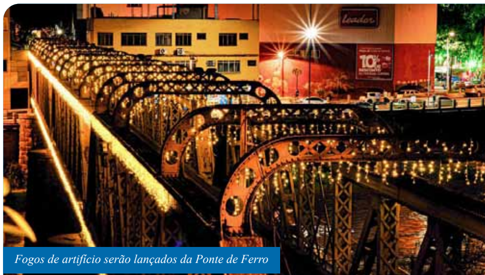
Fogos de artifício serão lançados da Ponte de Ferro

O projeto “Verão 2020: Viva Cachoeiro de Itapemirim” apresentará a cachoeirenses e visitantes atrações que evidenciarão o potencial artístico e cultural da cidade, com boas opções de