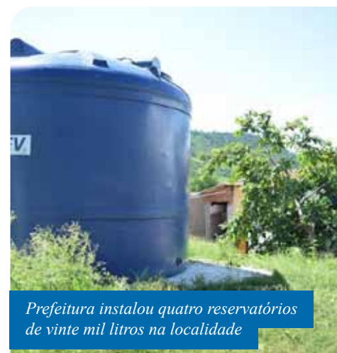
Prefeitura instalou quatro reservatórios de vinte mil litros na localidade

da intervenção. Para as próximas semanas, está prevista a entrega de três caixas d’água, de dez mil litros, para a comunidade do Córrego do Brás.