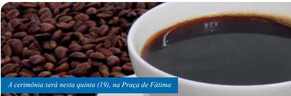
A cerimônia será nesta quinta (19), na Praça de Fátima

A divulgação dos melhores cafés produzidos em Cachoeiro será realizada em grande estilo, nesta quinta-feira (19), a partir das 18h, em plena Praça de Fátima, centro da cidade, com direito a degustação para o público e programação especial. É o evento Café na Praça, de premiação do Concurso de Qualidade e Sustentabilidade do Café Conilon 2019, promovido pela Prefeitura.