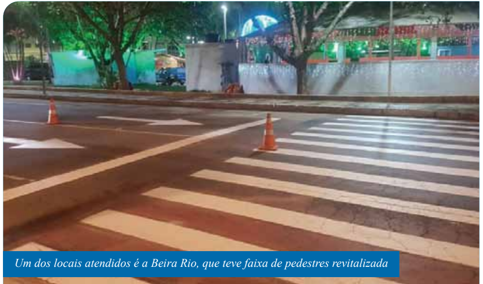
Um dos locais atendidos é a Beira Rio, que teve faixa de pedestres revitalizada

Outra recente ação da Semdurb com foco na