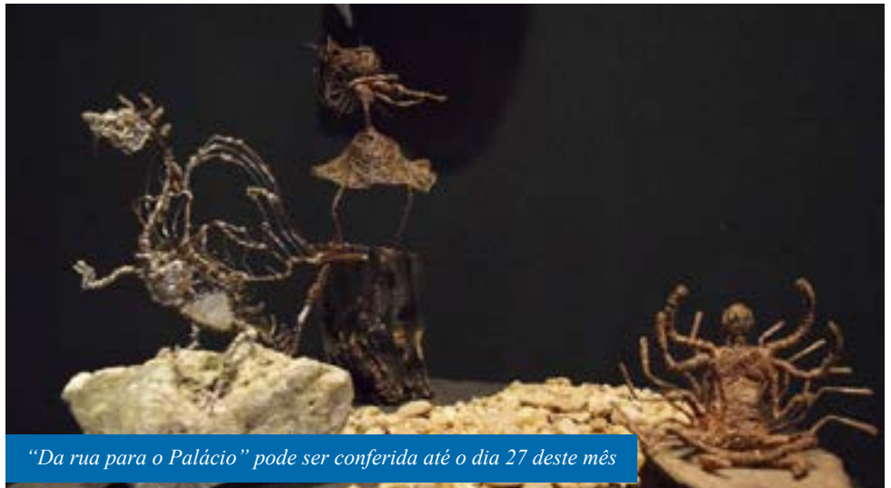
“Da rua para o Palácio” pode ser conferida até o dia 27 deste mês

“Já perdi a conta de quantos trabalhos fiz. A maior parte, cerca de 98%, eu vendo, mas guardo alguns comigo e presenteio”, ressalta, lembrando que as peças sempre levam um pouco dele e dos lugares por onde andou.