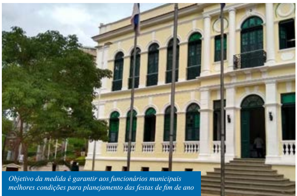
Objetivo da medida é garantir aos funcionários municipais melhores condições para planejamento das festas de fim de ano

“Com isso, injetaremos no mercado local em torno de R$ 21 milhões, dias antes do Natal e do Ano Novo, o que será muito bom para o comércio e para economia da cidade, como um todo”, destaca.