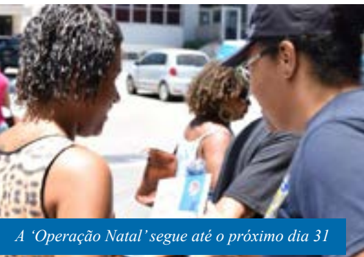
A 'Operação Natal' segue até o próximo dia 31

A Guarda Civil Municipal de Cachoeiro de Itapemirim iniciou, nesta segunda-feira (16), uma ação para divulgar dicas de segurança para a hora das compras de fim de ano.