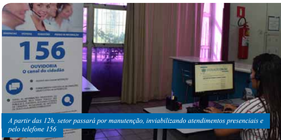
A partir das 12h, setor passará por manutenção, inviabilizando atendimentos presenciais e pelo telefone 156

Os atendimentos telefônicos e na sede da Ouvidoria (no Centro Administrativo Hélio Carlos Manhães – rua Brahim Antônio Seder, 34, térreo, Centro) serão restabelecidos na segunda-feira (9). Ambos são realizados, sempre de segunda a sexta, das 7h30 às 17h30.