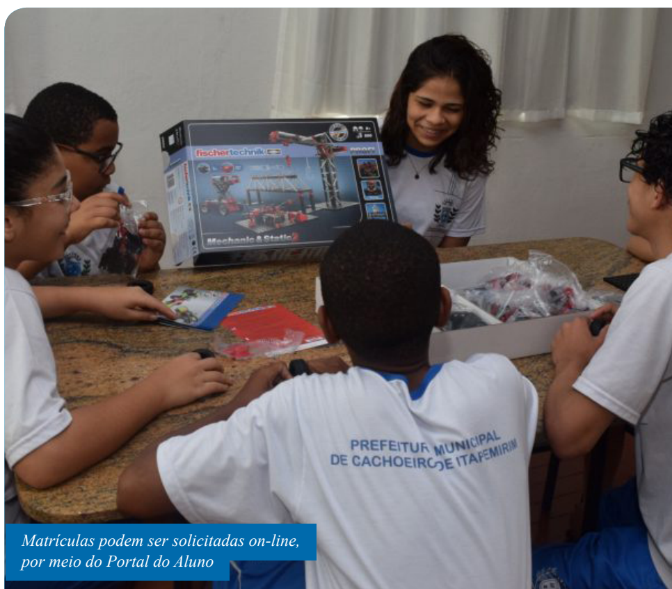
Matrículas podem ser solicitadas on-line, por meio do Portal do Aluno

“As matrículas on-line trazem facilidade para as famílias, evitando o desgaste de procurar vagas de escola em escola ou, mesmo, de enfrentar filas. Além disso, nas escolas em que