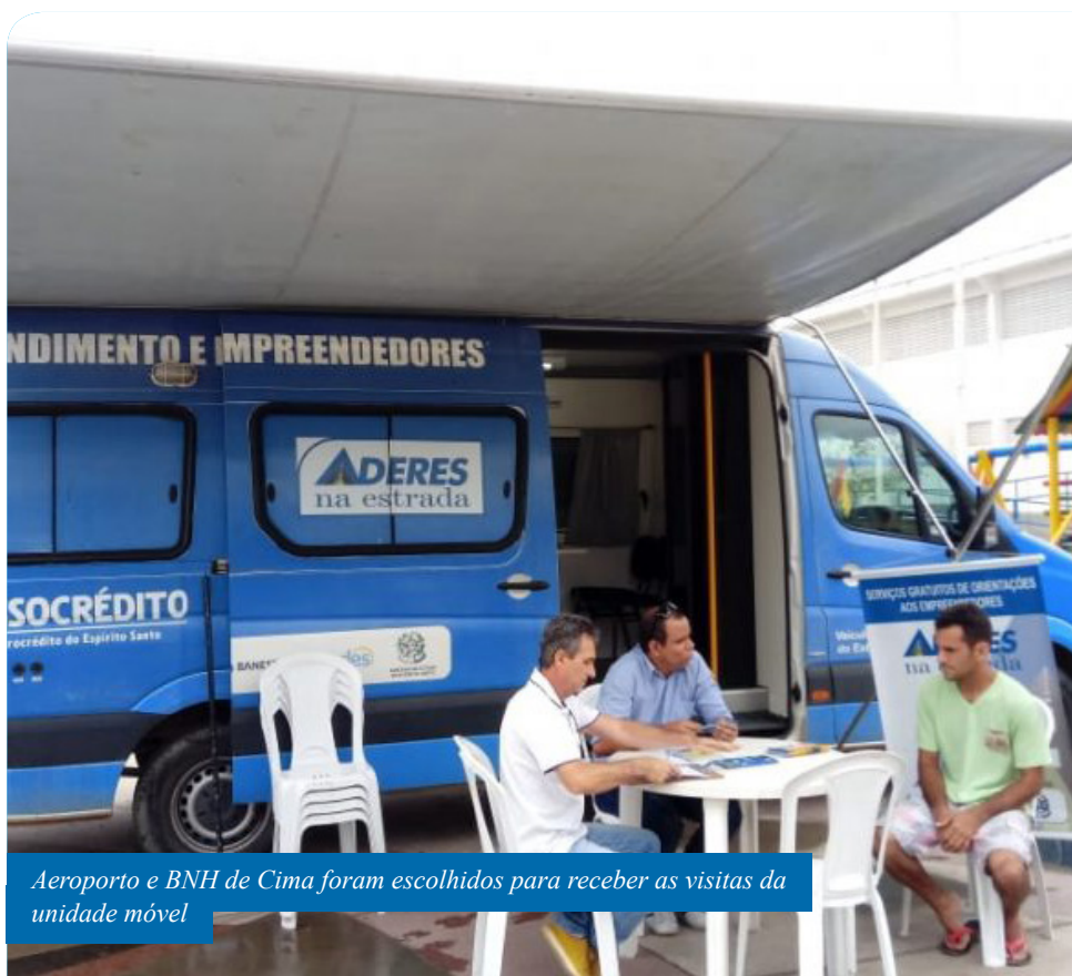
Aeroporto e BHN de Cima foram escolhidos para receber as visitas da unidade móvel

“O nosso trabalho com a Sala Itinerante é levar soluções as pessoas que precisam de orientações