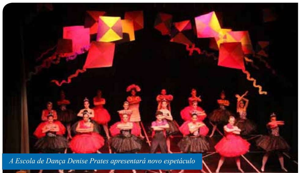
A Escola de Dança Denise Prates apresentará novo espetáculo

Confira a programação completa no site: www.cachoeiro.es.gov.br