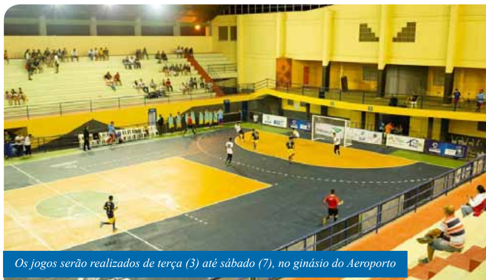
Os jogos serão realizados de terça (3) até sábado (7), no ginásio do Aeroporto

Confira a tabela dos jogos completa no site: www.cachoeiro.es.gov.br