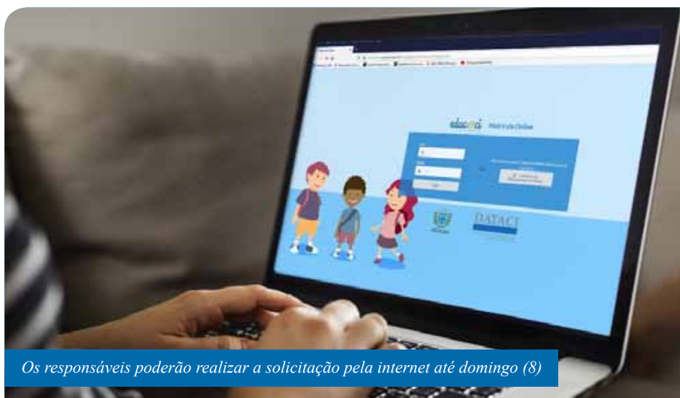
Os responsáveis poderão realizar a solicitação pela internet até domingo (8)

“Nós orientamos que todos os pais façam a matrícula nova no prazo estipulado, para que sua solicitação seja garantida, na escola escolhida. A Seme fará o possível para atender à demanda dos responsáveis, mas pedimos que os pais fiquem atentos às datas, especialmente, das de confirmação