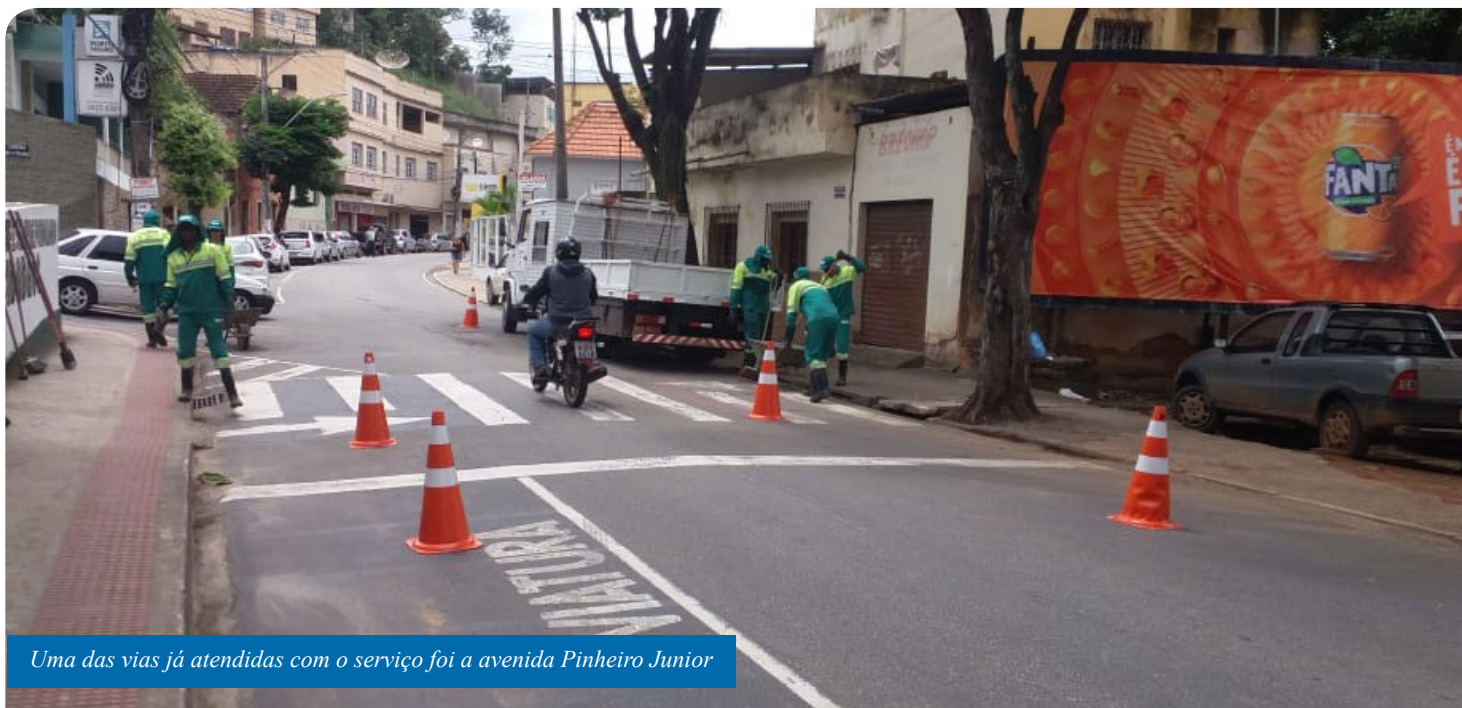
Uma das vias já atendidas com o serviço foi a avenida Pinheiro Junior

A Prefeitura de Cachoeiro de Itapemirim reforçou as ações de limpeza, desobstrução e manutenção de bueiros da cidade. O objetivo é evitar alagamentos no período chuvoso.