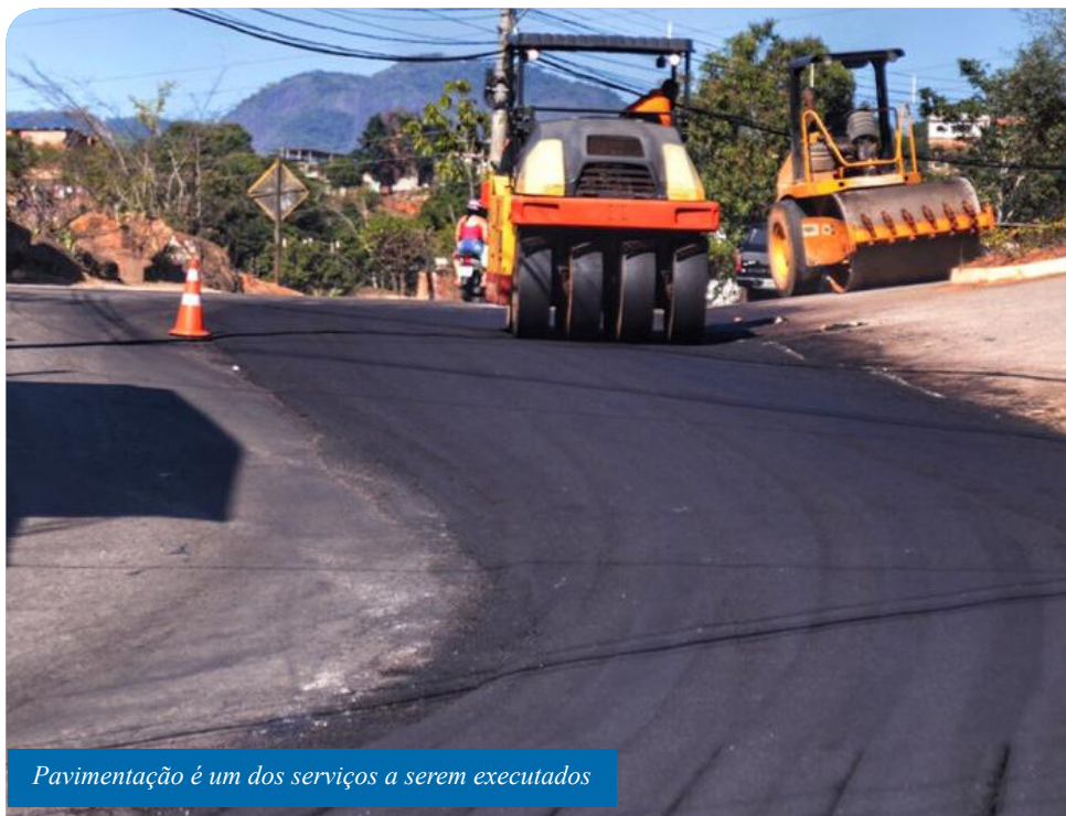
Pavimentação é um dos serviços a serem executados

Em seguida, às 11h, será realizada a entrega das obras de pavimentação e drenagem em seis ruas do Fé e Raça: Juriti, das Gaivotas, das Araras, dos Coleiros, dos Tucanos e do Faisão. A solenidade ocorrerá próximo à escola municipal “Prof.ª Gércia Ferreira Guimarães”. Foram investidos, nas obras, cerca de R$ 500 mil.