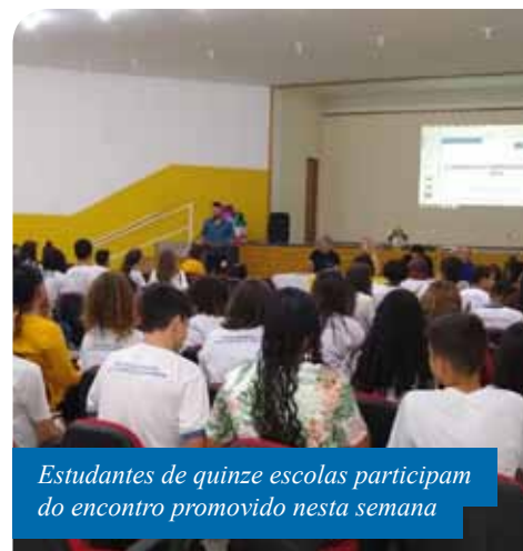
Estudantes de quinze escolas participam do encontro promovido nesta semana

“Proporcionar aprendizado, liderança, voz e vez. Essa é a função dos grêmios e ficamos