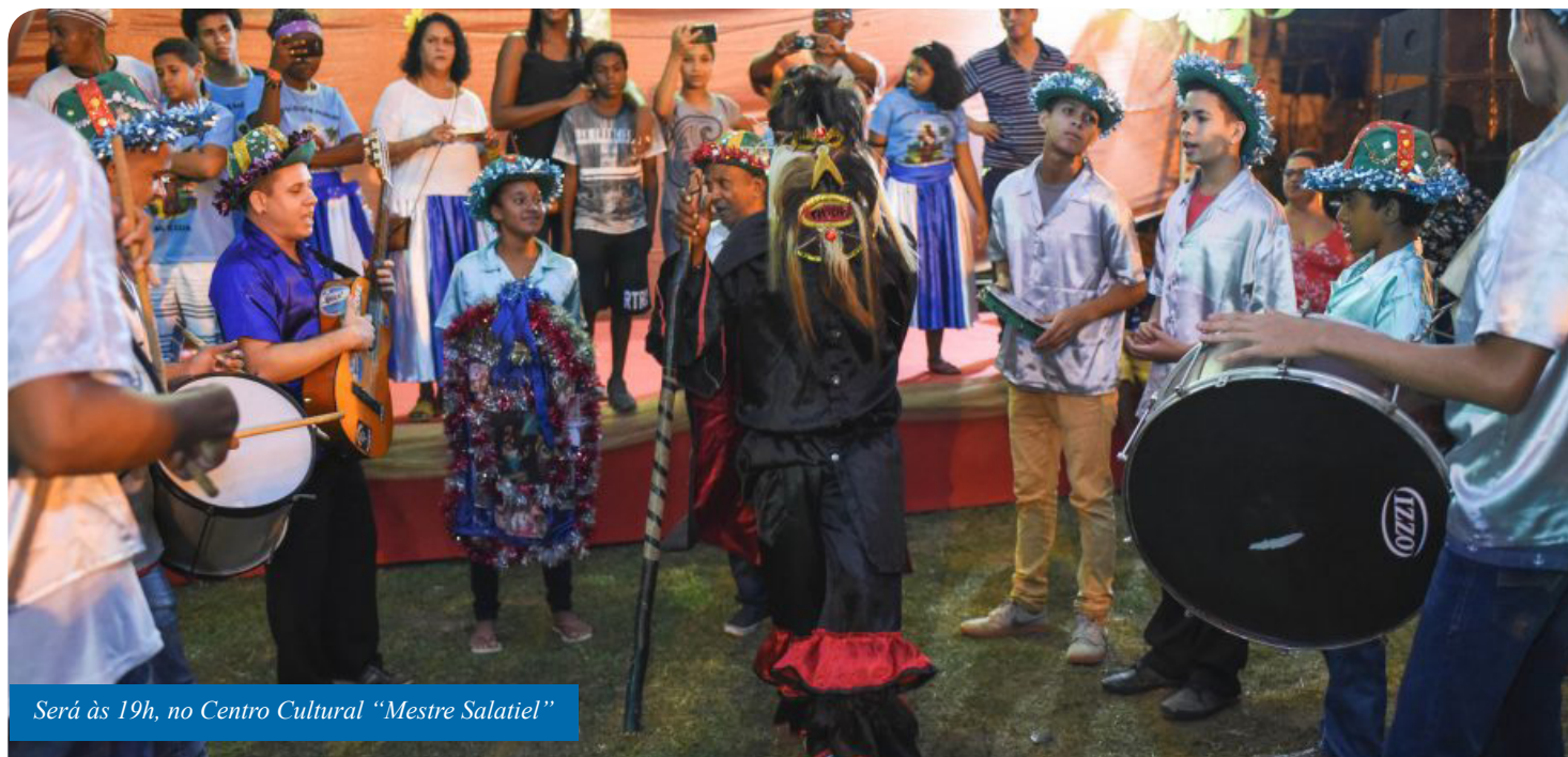
Será às 19h, no Centro Cultural “Mestre Salatiel”

A Secretaria Municipal de Cultura e Turismo (Semcult) de Cachoeiro realiza, na sexta-feira (29), o VII Seminário de Patrimônio Imaterial “Transmitindo conhecimento, preservando memória”. Será a partir das 19h, no Centro Cultural “Mestre Salatiel”, no bairro Recanto.