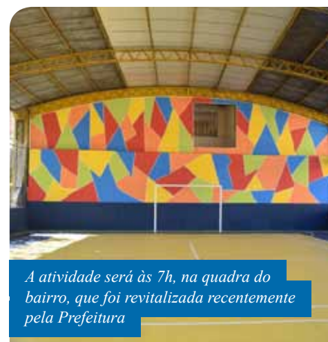
A atividade será às 7h, na quadra do bairro, que foi revitalizada recentemente pela Prefeitura

É importante lembrar que os interessados devem apresentar laudo médico, atestando terem condições físicas para a prática. Para mais informações sobre locais e dias das atividades, ligue para 3155-5616.