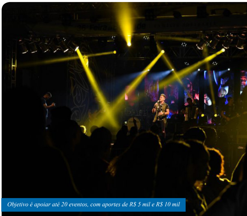
Objetivo é apoiar até 20 eventos, com aportes de R$ 5 mil e R$ 10 mil

“O edital foi criado para valorizar as festas