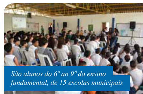
São alunos do 6º ao 9º do ensino fundamental, de 15 escolas municipais