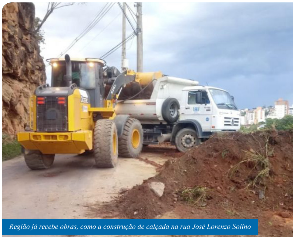
Região já recebe obras, como a construção de calçada na rua José Lorenzo Solino

Com as duas primeiras edições do Transforma Cachoeiro, foram realizados quase 20 mil atendimentos e entregues diversas obras públicas. O programa oferece um grande mutirão de serviços públicos a bairros e distritos do município. A finalidade é alcançar, de forma