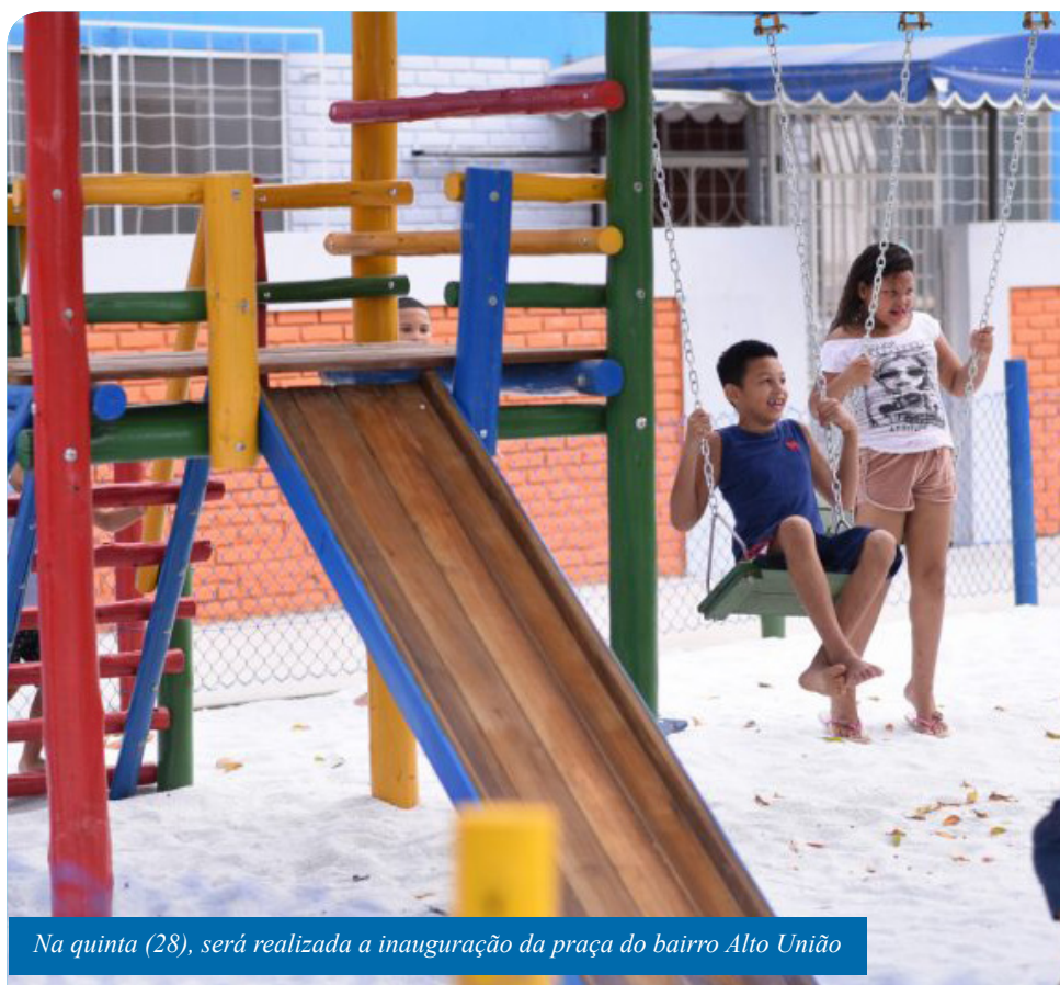
Na quinta (28), será realizada a inauguração da praça do bairro Alto União

Seis espaços Viva Mais já foram inaugurados pela Prefeitura. Ficam nos bairros Aeroporto, Paraíso e Baiminas, e nos distritos de Itaoca, Soturno e Gironda. Já os brinquedos do Lazer Para Todos foram instalados em Gironda, Baiminas,