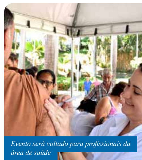
Evento será voltado para profissionais da área de saúde