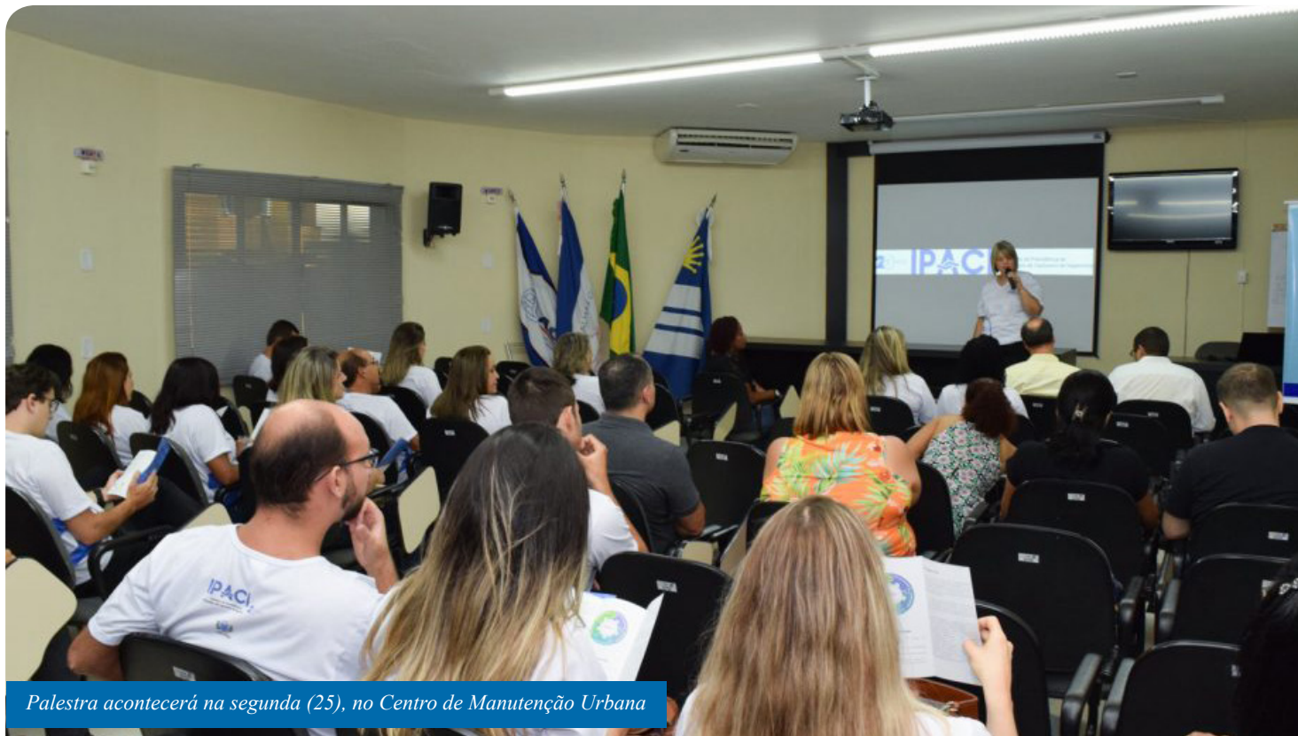
Palestra acontecerá na segunda (25), no Centro de Manutenção Urbana

Dando continuidade ao seu projeto de Educação Previdenciária, voltado aos servidores municipais de Cachoeiro, o Instituto de Previdência do Município (Ipaci) promoverá, na segunda-feira (25), uma palestra com o tema “Pré Aposentadoria”. Será a partir das 7h30, no auditório do Centro de Manutenção Urbana, no bairro São Geraldo.