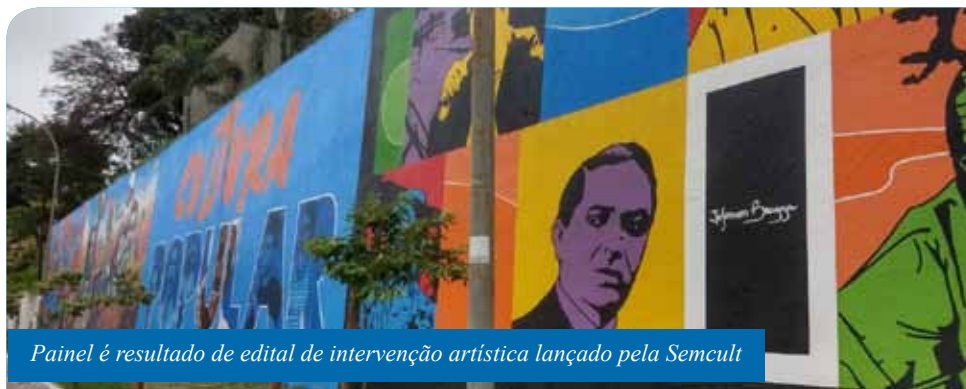
Painel é resultado de edital de intervenção artística lançado pela Semcult

“Este mural é mais ação de reconhecimento a nomes que fizeram e fazem Cachoeiro grande. E além de homenageá-los, podemos, ainda, investir na proposta de educação patrimonial e no sentimento de pertencimento, porque, acreditamos que os cachoeirenses e visitantes, quando virem essa arte maravilhosa, terão a curiosidade de querer saber, caso não saibam, quem foram essas pessoas e isso vai gerar mais