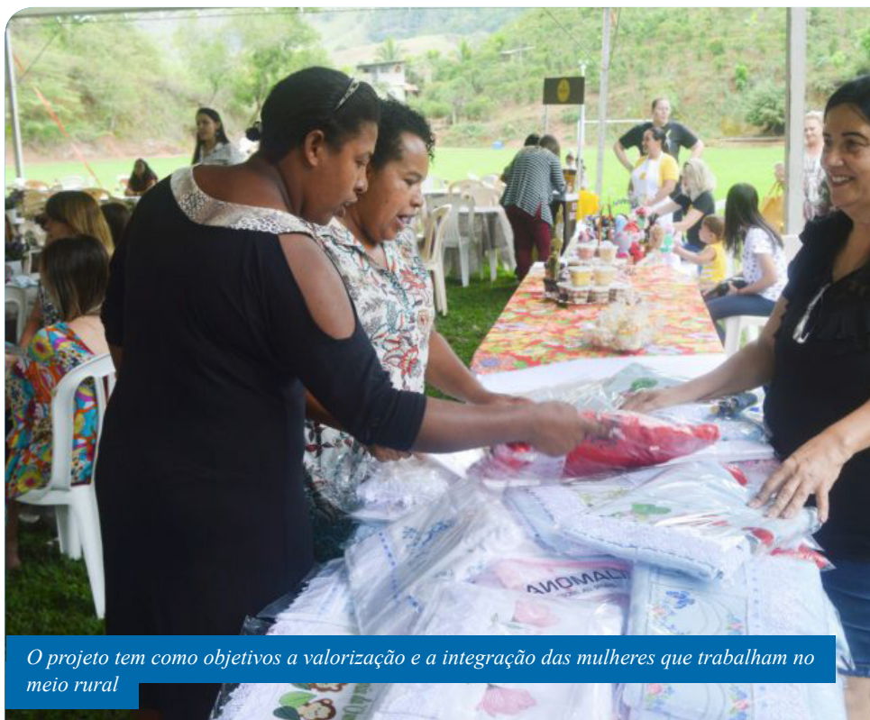
O projeto tem como objetivos a valorização e a integração das mulheres que trabalham no meio rural