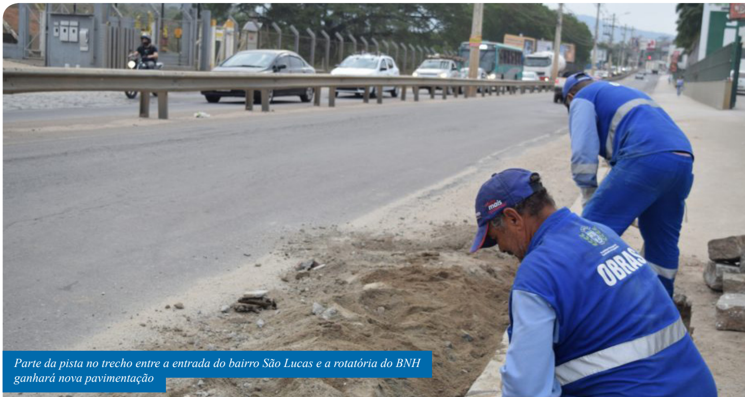
Parte da pista no trecho entre a entrada do bairro São Lucas e a rotatória do BNH ganhará nova pavimentação

Um trecho de cerca de 75 metros da avenida Jones dos Santos Neves, entre a entrada do bairro São Lucas e a rotatória do BNH, recebe obras desde terça-feira (5). Por conta das intervenções, o trânsito está em meia pista no local.