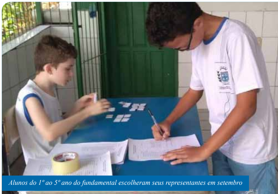
Alunos do 1º ao 5º ano do fundamental escolheram seus representantes em setembro

“É um movimento que auxilia a gestão escolar para propor, através do diálogo e ações, melhorias na estrutura da escola, na organização pedagógica e no relacionamento entre estudantes, professores e famílias. São frentes muito importantes