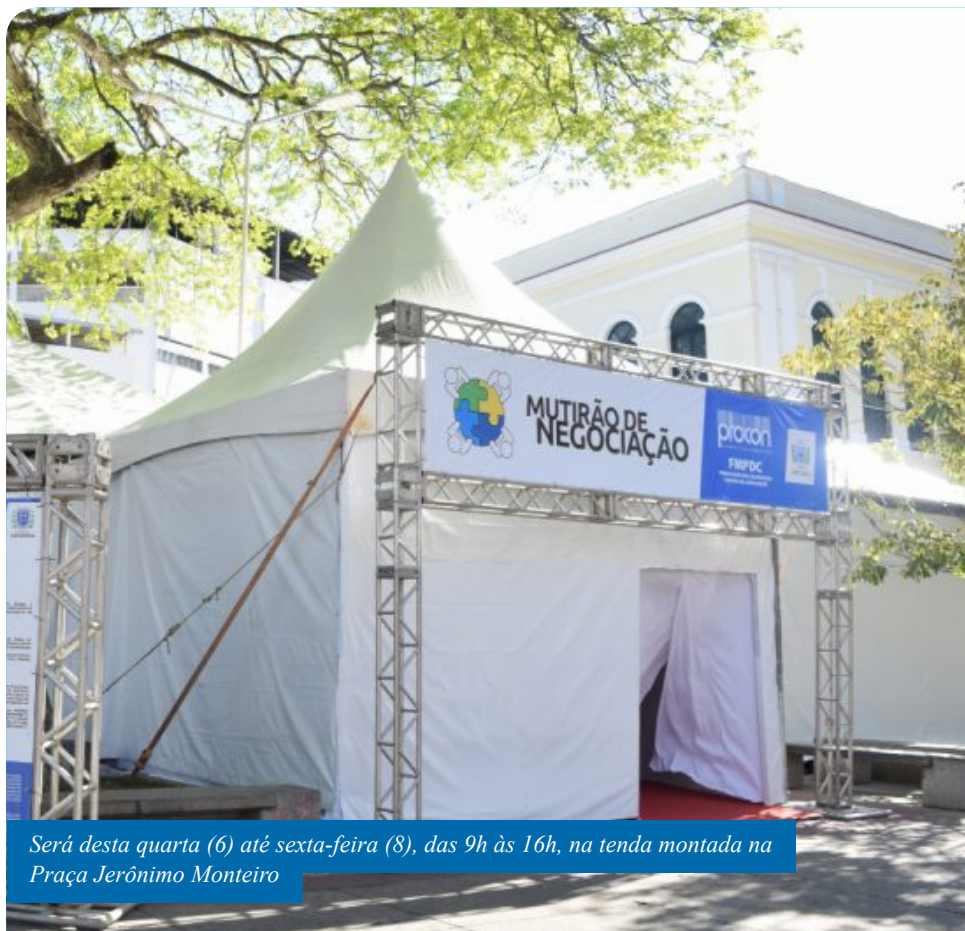
Será desta quarta (6) até sexta-feira (8), das 9h às 16h, na tenda montada na Praça Jerônimo Monteiro

“Ao término de cada atendimento, o servidor do Procon verificará o respectivo termo de acordo e orientará o consumidor a finalizá-lo ou não, caso