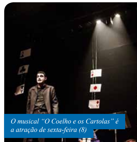
O musical “O Coelho e os Cartolas” é a atração de sexta-feira (8)

Confira a programação completa no site www.cachoeiro.es.gov.br