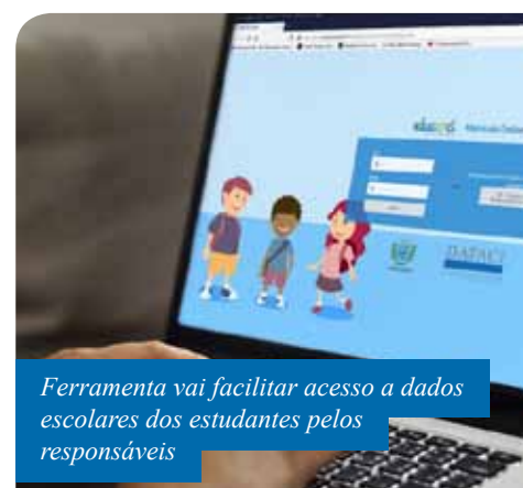
Ferramenta vai facilitar acesso a dados escolares dos estudantes pelos responsáveis