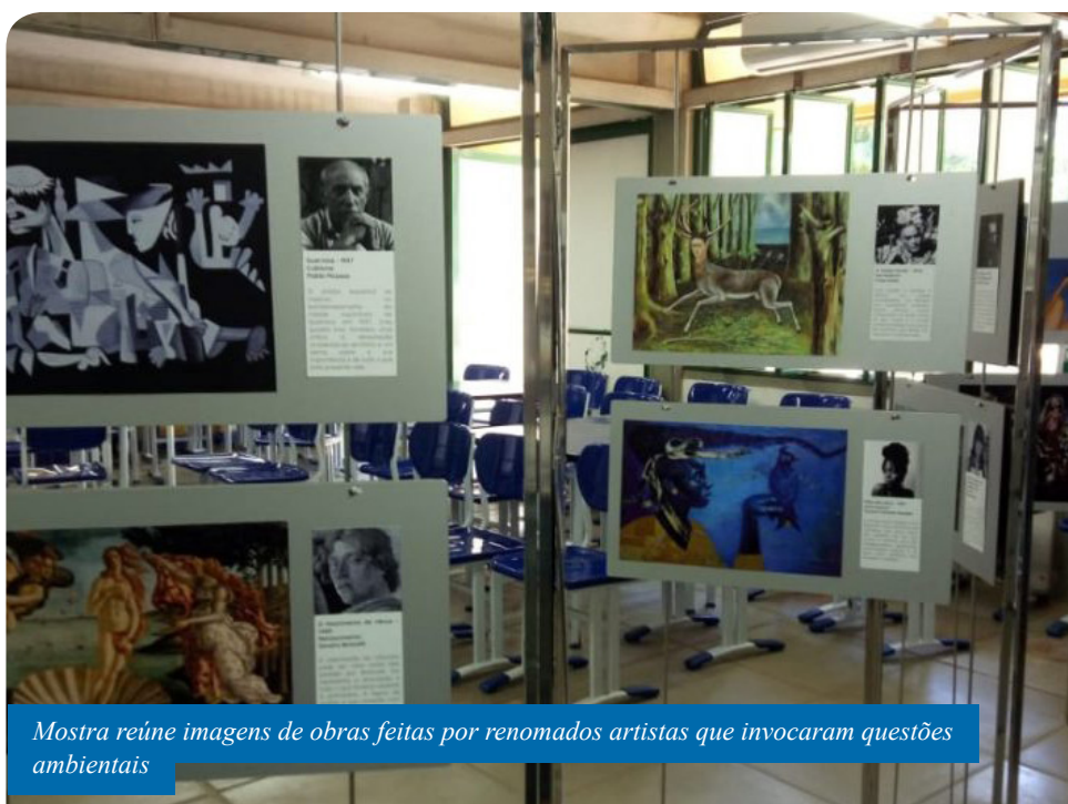
Mostra reúne imagens de obras feitas por renomados artistas que invocaram questões ambientais

“Aliar cultura e meio ambiente fortalece a cidadania e o desenvolvimento crítico. Assim, ter