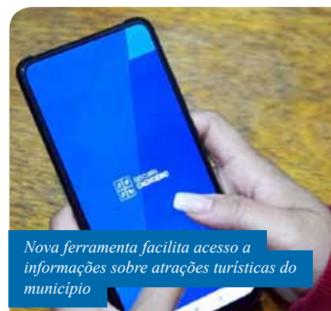
Nova ferramenta facilita acesso a informações sobre atrações turísticas do município