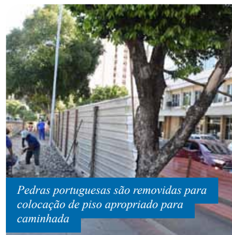
Pedras portuguesas são removidas para colocação de piso apropriado para caminhada