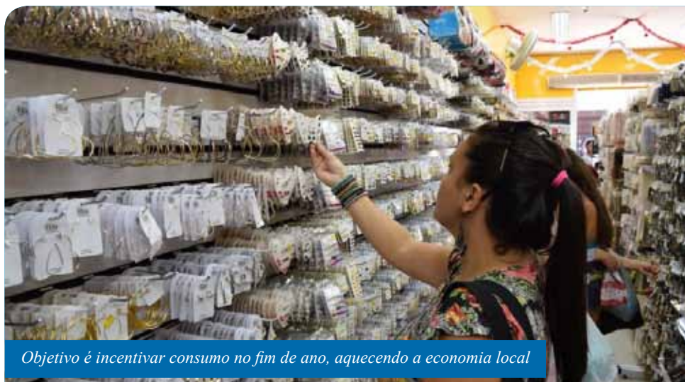
Objetivo é incentivar consumo no fim de ano, aquecendo a economia local

“Temos um mercado cada vez mais competitivo, a ação promocional é de grande valia para o município, já que motiva a população a consumir no comércio local. É uma época muito esperada pelos lojistas e temos de aproveitar a injeção de recursos que acontece nesse período. Com o aumento das vendas, consolidamos Cachoeiro como o principal