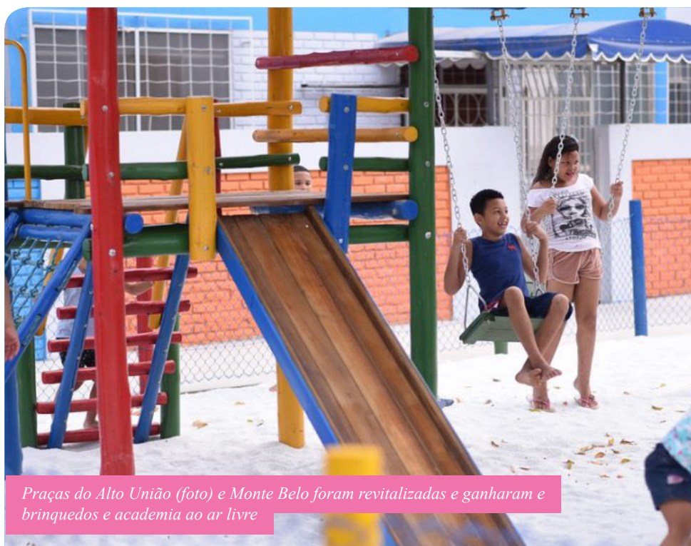
Praças do Alto União (foto) e Monte Belo foram revitalizadas e ganharam e brinquedos e academia ao ar livre

Parte das obras ainda está sendo concluída. Os serviços são realizados por equipes das secretarias municipais de Obras (Semo), Agricultura e Interior (Semai) e Esporte e Lazer (Semesp). Já a secretaria de Serviços Urbanos (Semsur) ficou responsável pelo paisagismo e pela limpeza urbana da região, com atividades de capina, varrição, poda de árvores, retirada de entulho e