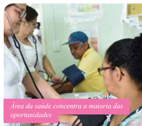
Área da saúde concentra a maioria das oportunidades

Para efeito de classificação, serão computados tempo de serviço na função pleiteada e a formação, que varia de acordo com o tipo de cargo. Para ter acesso aos pré-requisitos de cada um e às exigências previstas, o servidor deve conferir as regras previstas no edital 03/2019, que já está disponível no site da prefeitura (em “Editais”, no menu “Transparência”) e será publicado no Diário Oficial do Município nesta quinta-feira (31).