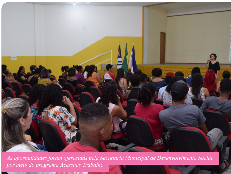
As oportunidades foram oferecidas pela Secretaria Municipal de Desenvolvimento Social, por meio do programa Acessuas Trabalho

“São oficinas que têm como objetivo abrir o horizonte para o trabalho, abrir possibilidades nesse campo. O programa é oferecido desde