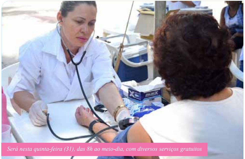
Será nesta quinta-feira (31), das 8h ao meio-dia, com diversos serviços gratuitos