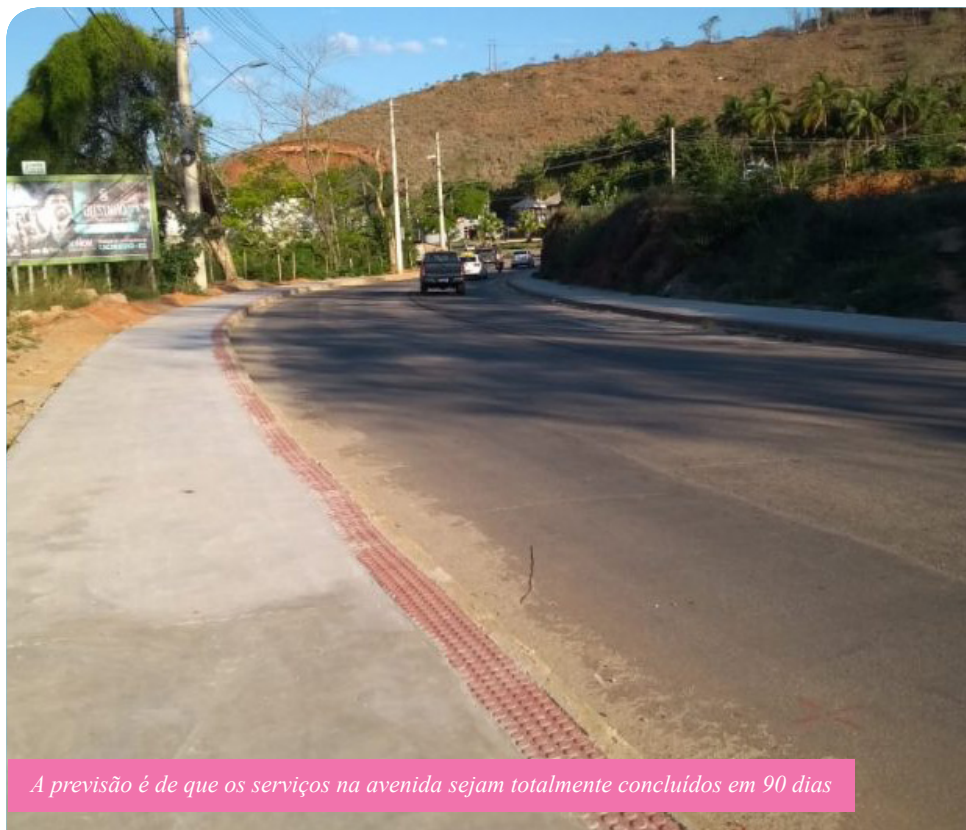
A previsão é de que os serviços na avenida sejam totalmente concluídos em 90 dias

“A rodovia do Valão é uma das principais vias de Cachoeiro e nós estamos realizando esse importante serviço de recuperação tomando todos os cuidados para minimizar transtornos.