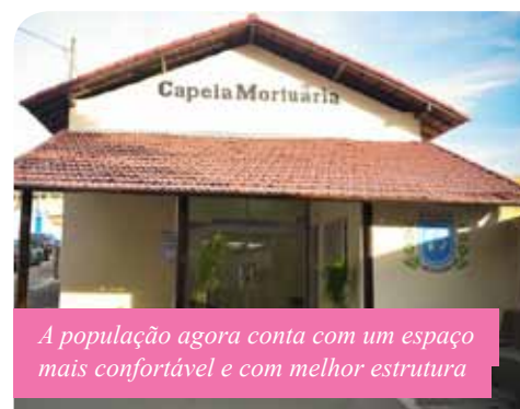
A população agora conta com um espaço mais confortável e com melhor estrutura

município. Têm recebido melhorias os que se encontram nos bairros Coronel Borges e Aeroporto, nos distritos de Conduru e Itaoca e nas localidades de Santa Rosa e São Simão. Neste último, a secretaria também faz pequenas reformas e reconstrói um muro.