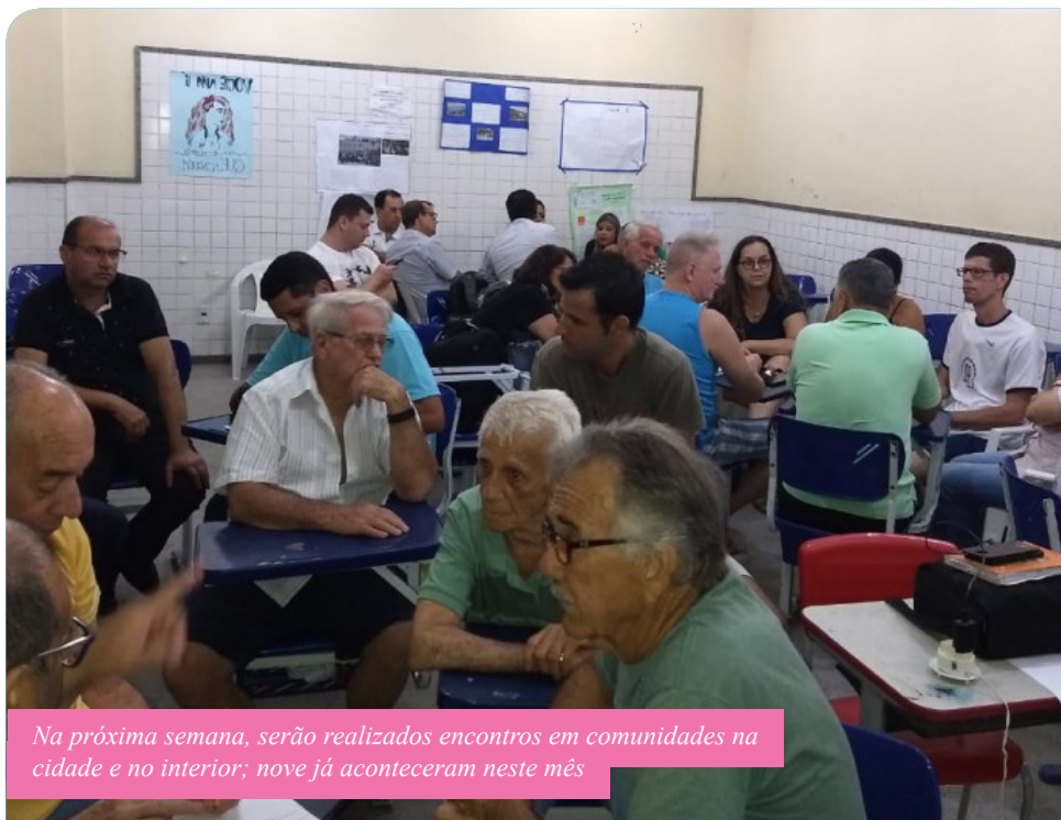
Na próxima semana, serão realizados encontros em comunidades na cidade e no interior; nove já aconteceram neste mês

Também é possível contribuir com a elaboração do novo PDM pela internet. No site da Prefeitura de Cachoeiro ( www.cachoeiro.es.gov.br ), foi disponibilizado o Espaço Plano Diretor, para que a população faça sugestões ao poder público. A página virtual ainda disponibiliza informações,