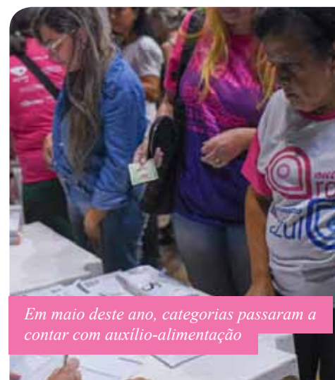
Em maio deste ano, categorias passaram a contar com auxílio-alimentação

“Nós estamos buscando a valorização constante dos agentes, inclusive garantido os reajustes anuais, para que não haja mais defasagens salariais ao longo do tempo”, afirma o prefeito Victor Coelho.