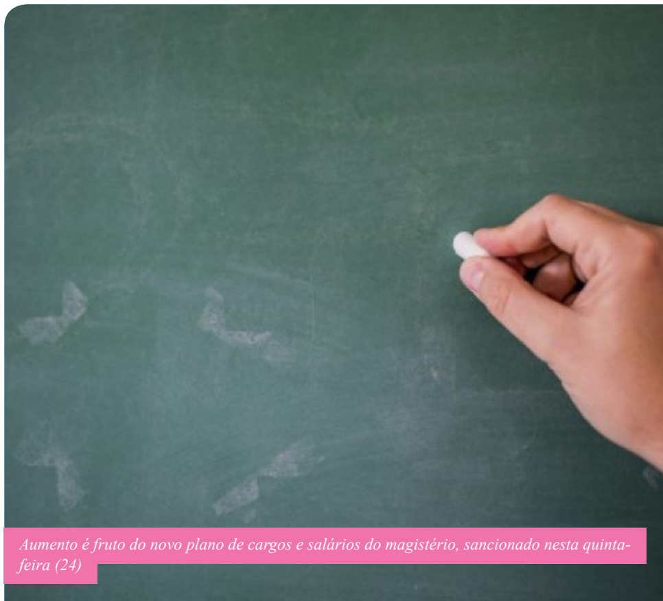
Aumento é fruto do novo plano de cargos e salários do magistério, sancionado nesta quinta-feira (24)

“O novo plano de cargos do magistério é prova do compromisso da gestão municipal com a valorização dos profissionais da educação, que, para além da importante melhoria salarial, se manifesta, também, nos investimentos em formação continuada e em