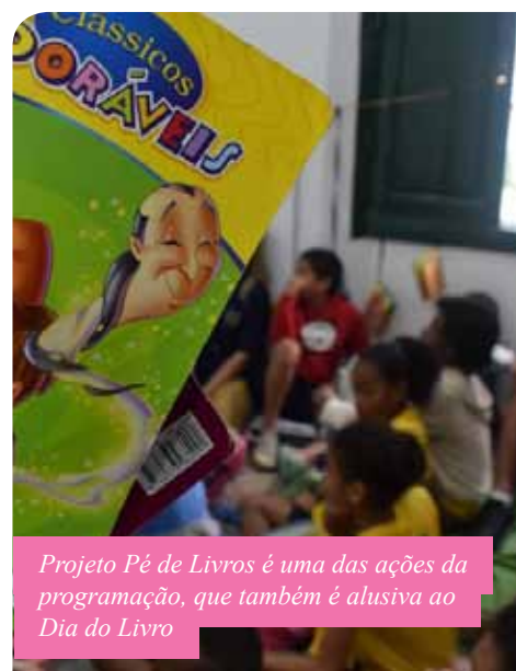
Projeto Pé de Livros é uma das ações da programação, que também é alusiva ao Dia do Livro

Também faz parte da programação a exposição do projeto Cabide de Letras, de