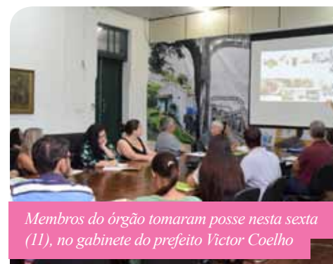
Membros do órgão tomaram posse nesta sexta (11), no gabinete do prefeito Victor Coelho

muito significativa para a aplicação das políticas públicas, e a criação de uma câmara com essas características voltada para uma área fundamental para o desenvolvimento social do município certamente trará muitos benefícios”, destaca o prefeito Victor Coelho.