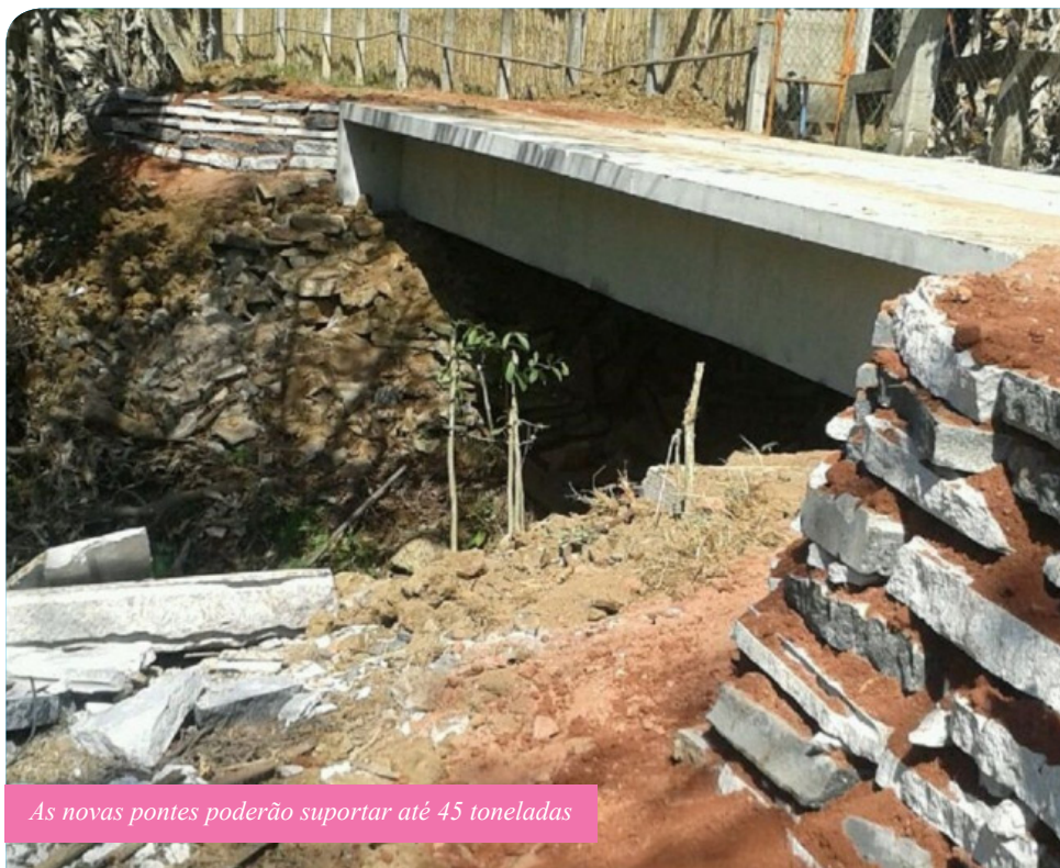
As novas pontes poderão suportar até 45 toneladas

“Agora, as pessoas vão poder construir mais moradias por aqui. Ficou muito mais seguro tanto o escoamento de pessoas como de materiais e produtos, vai nos ajudar bastante na locomoção e no transporte. Agradecemos a ação da prefeitura, pois esse serviço é muito bem-vindo. Essa reforma é um sonho realizado, algo que a gente esperava há muito tempo”, celebra