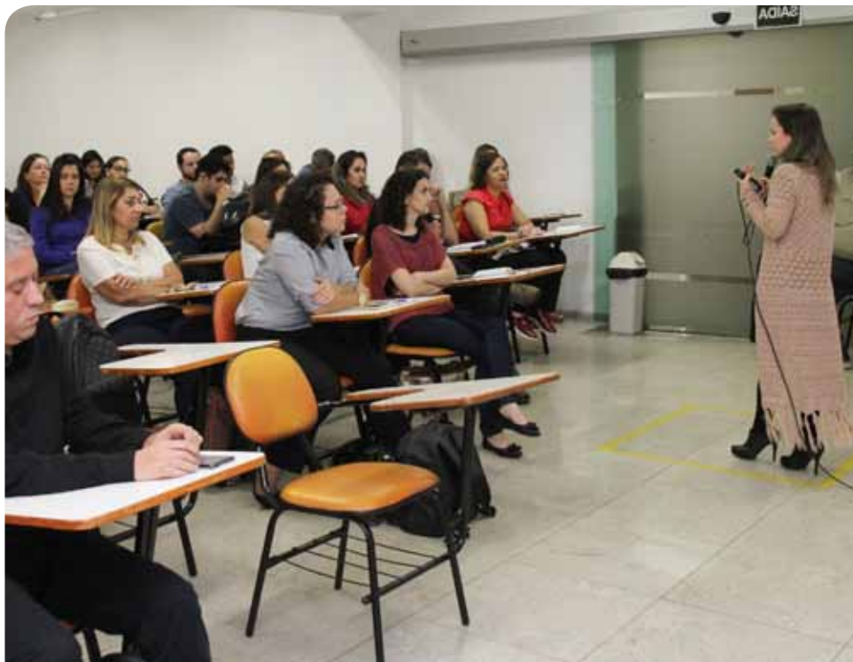
Atividade será na próxima quarta (11), das 8h30 às 10h30, no auditório da Seme

“Uma das premissas básicas da atual gestão municipal é a transparência. A oferta de cursos e palestras para os conselheiros municipais, esclarecendo e qualificando sobre as rotinas dos processos licitatórios, vem ao encontro