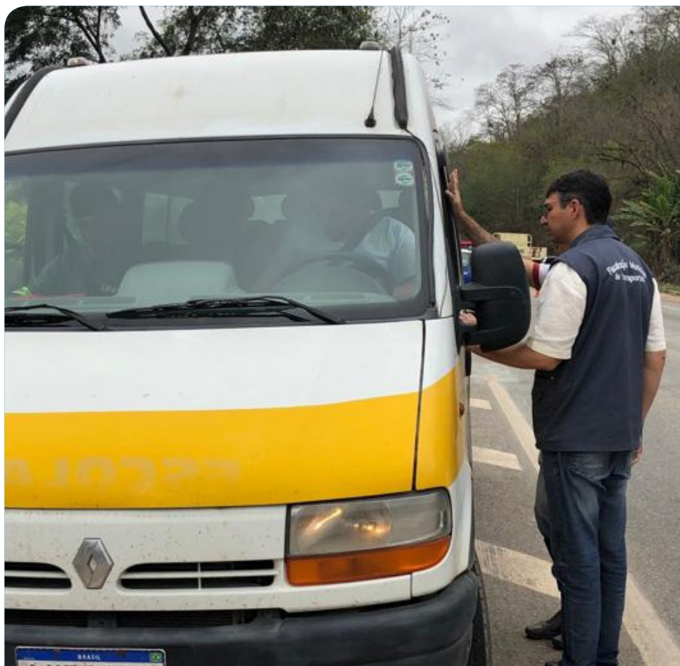
Ações foram realizadas na última semana, resultando em 11 autos de infração