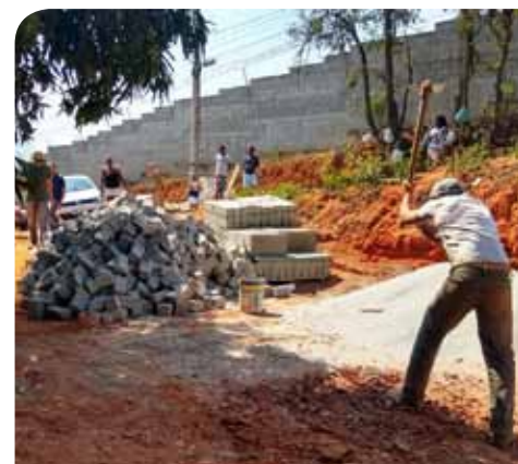
No Zumbi, serviços foram iniciados na última semana