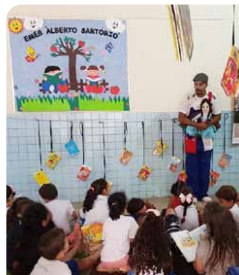
Projeto mobiliza estudantes para a próxima edição da Bienal Rubem Braga

As próximas datas do projeto Pé de Livros já estão marcadas. Dia 12 de setembro, na praça do Nova Brasília (em frente a escola Rotary), a partir das 9h; 19 de setembro, na praça do bairro Amarelo, às 14h; e dia 26 de setembro, na biblioteca pública municipal “Major Walter dos Santos Paiva”, que funciona na Casa da Memória, às 9h.